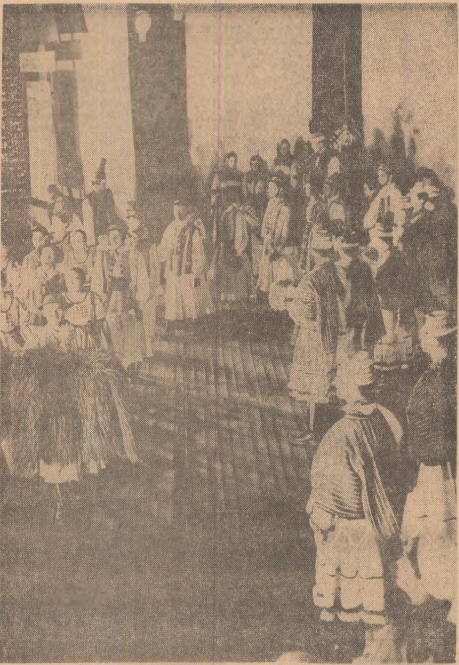
Moment din spectacolul prezentat de reprezentanții regiunii Maramureș

Un profesor și fascinația relievelor arheologice • Cărusul de milenii • Drama de la Novum Forum • Sub zidurile cetății strămoșești