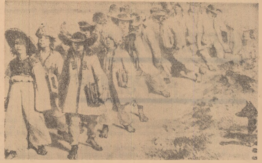
Școlari români din Orșova ieșind de la cursuri în ziua de 18 iulie 1837. Desenul este realizat „după natură” de Auguste Raffet și publicat într-un album de călătorie