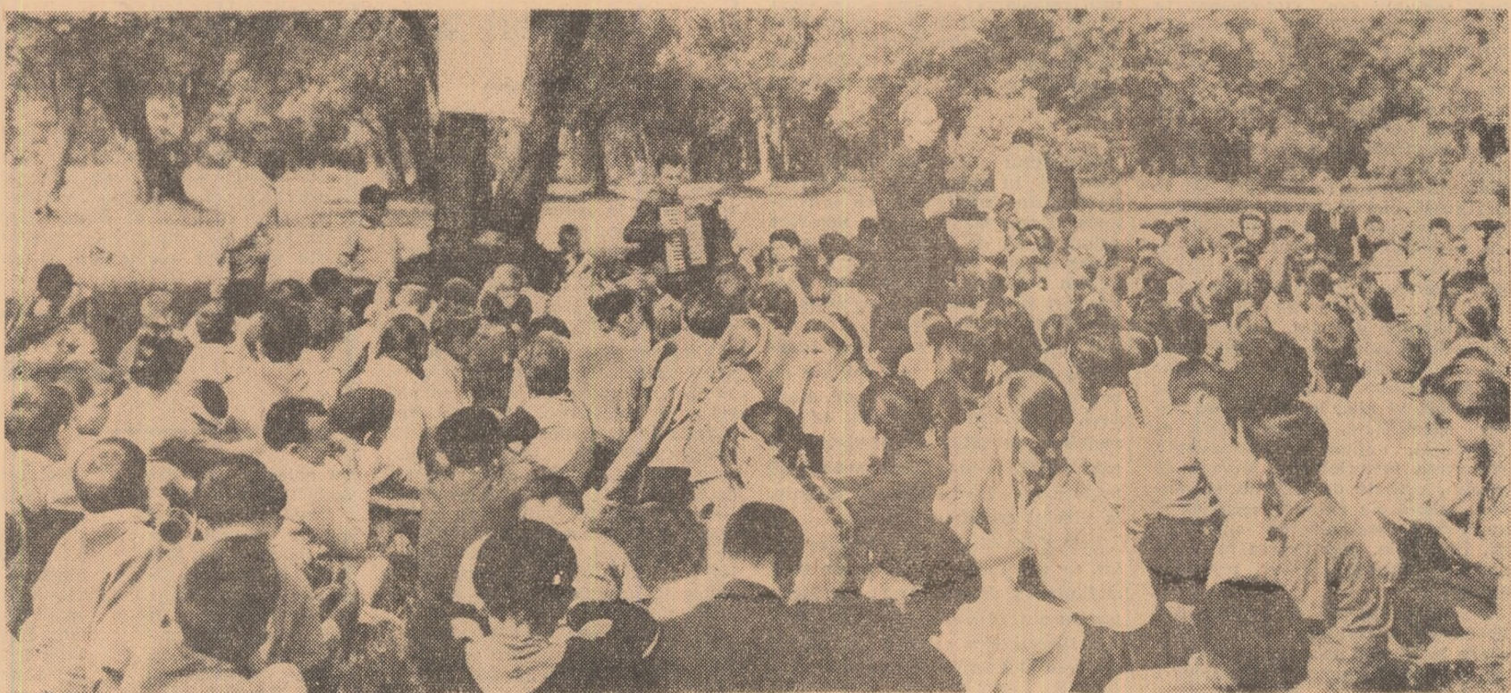
Cînt și veselite în pența taberei de la Bucsoaia, regiunea Suceava.

Se știe că elevii îndrăgesc mult drumeția. Dar cum este organizată ea uneori? Copiii sînt purtați pe trasee arhicunoscute — așadar neinteresează pentru ei — pînă la un anumit „obiectiv” — un luminis din pădure, să zicem. Acolo sînt lăsați „să se joace” singuri (cadrele didactice se retrag să se distreze, deoparte și ele) și, după un timp, se dispune întorcerea, cu făgăduiala: „data viitoare vom sta mai mult și vom petrece (?) mai bine”. Sau se vizitează două-trei unități industriale și agricole din localitate, nu o dată vizitate de elevi în cursul anilor școlari. Este firesc ca pe copii să nu-i mai atragă, să-i obosească, asemenea activități organizate numai fiindcă au fost prevăzute cu săptămîni ori luni în urmă într-un plan alcătuit fără consultarea lor. Au loc de multe ori și excursii lungi, cu obiective în general interesante. Dar la ce rezultate se poate ajunge cînd, pentru a se epuiza un program supraîncărcat, vizitele se fac „în galop”? Școlarul intră în