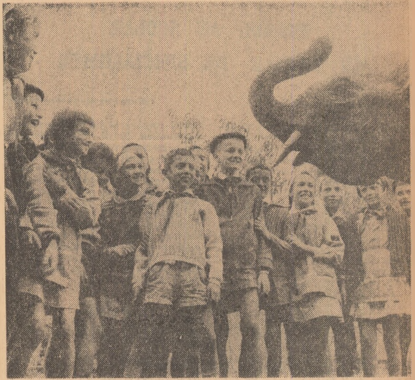
Grădina școlară de la Băneasa cunoaște o deosebită afluență în zilele vacanței