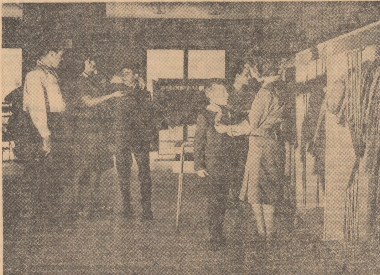
Una dintre bucuriile începutului de an școlar: procurarea noilor și elegantelor uniforme școlare.