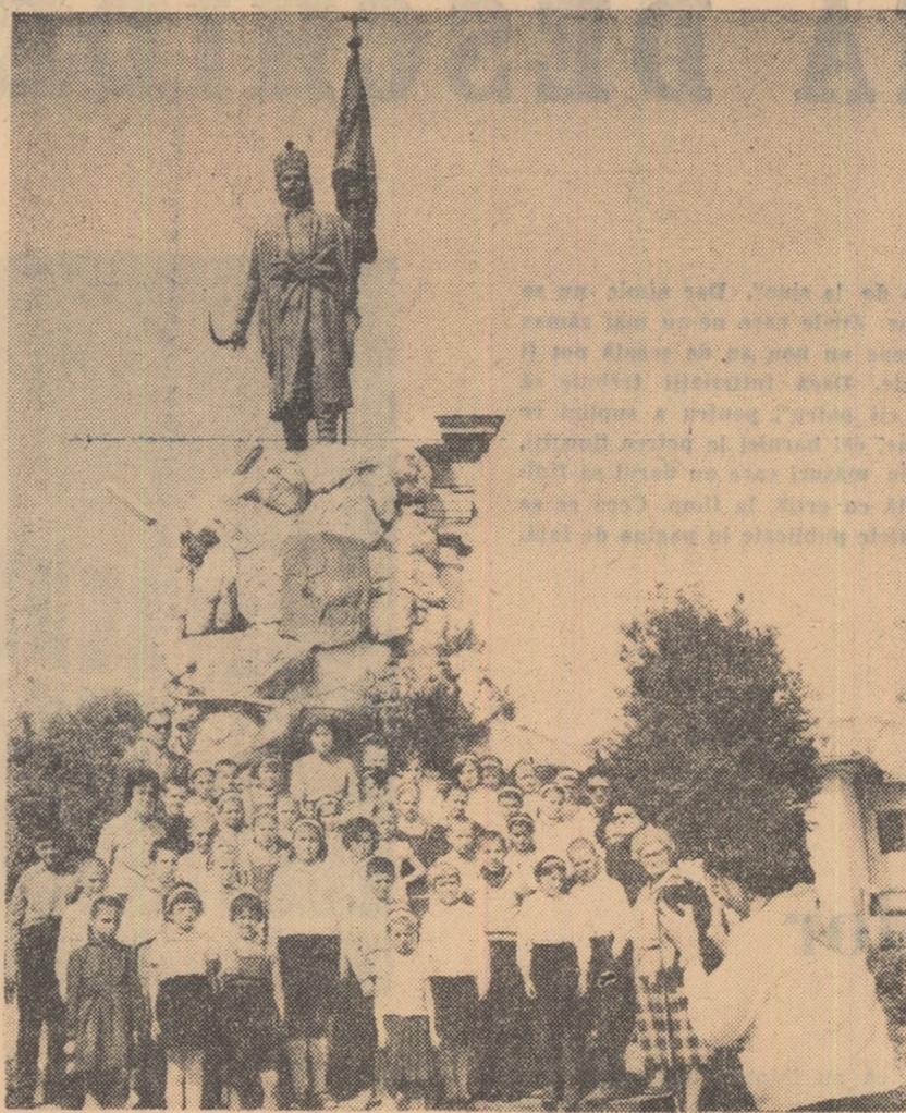
Elevii ai Școlii generale din Podari în excursie la Tirgu Jiu.