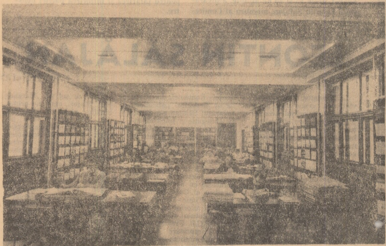
Într-una din sălile de lectură ale Bibliotecii Universitare „M. Eminescu” din Iași.