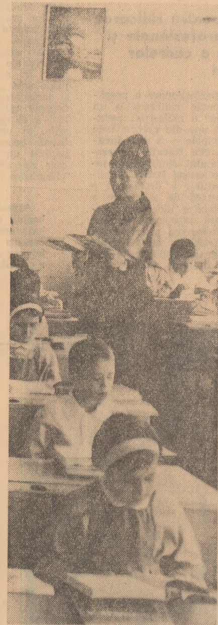
La o oră de lecturi istorice.