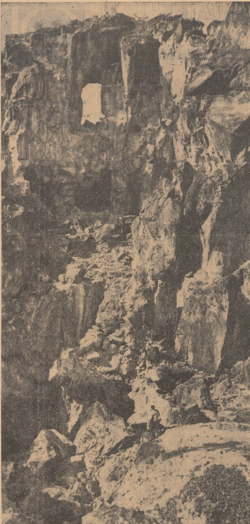
URMELE ISTORIEI — Cetate romană din Munții Apuseni.

Aspectele prezentate mai sus sînt numai câteva crîmpele dintr-o bogată activitate în care s-a acumulat o valoroasă experiență. Pe baza acestei experiențe și aplicînd indicațiile concrete pe care le-au cuprins expunerile din cadrul instructajului, organizațiile sindicale își vor putea spori tot mai mult aportul la continua imbunătățire a activității instructiv-educative din școli.