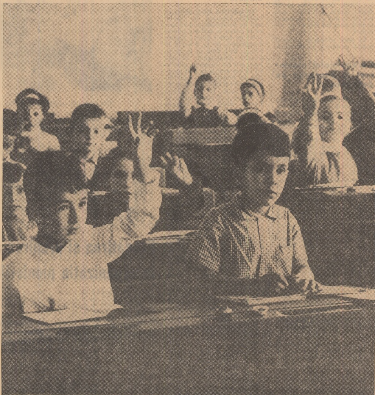
Atitudinea elevilor în timpul lecției — un punct de plecare pentru multiple observații psihologice și pedagogice.