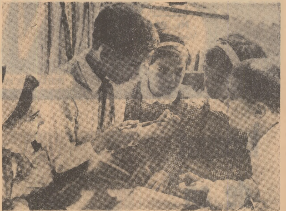
Cei mai mici școlari sînt sfătuiți de prietenii lor mai mari, pionierii.

Pionierii, schițînd la rîndul lor salutul, răspund: „Tot înainte!”