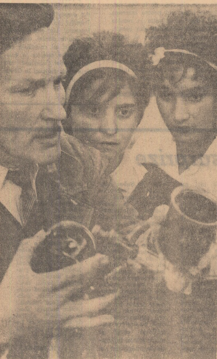
Oră de practică la Liceul industrial de construcții din Capitală.