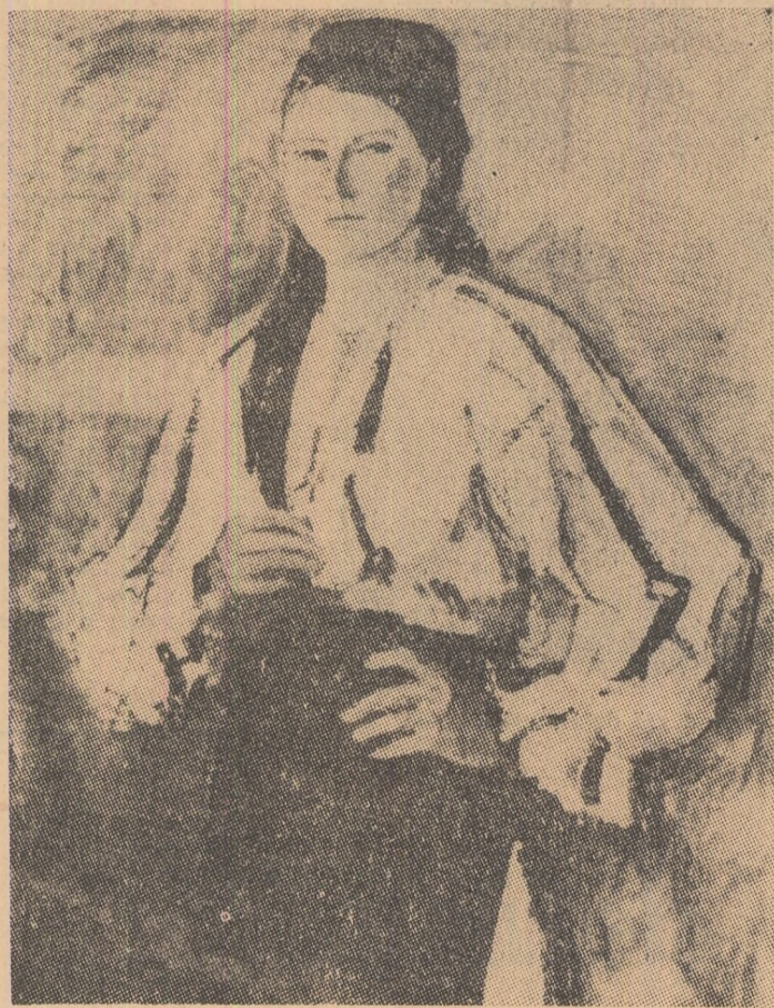
Portret de țărăncă. (Din expoziția pictorului Dinu Șerban).