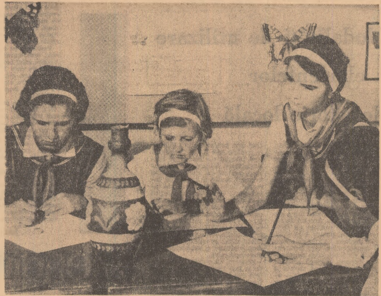
Arta populară — izvor de inspirație.

Organizind cu seriozitate și simț de răspundere lecțiile de educație fizică și activitățile din cadrul asociațiilor sportive, școlile trebuie să țină seama în același timp de faptul că principala sarcină a elevilor rămîne învățătura, că întregul proces instructiv-educativ trebuie subordonat acestui scop. Ridicarea substanțială a nivelului activităților sportive în școli, la nivelul celorlalte activități, nu împiedică realizarea lui. Dimpotrivă, formarea unui organism sănătos, armonios dezvoltat, are răsunet în sfera tuturor proceselor psihice și intelectuale, organismul uman fiind un tot unitar, organic și funcțional.