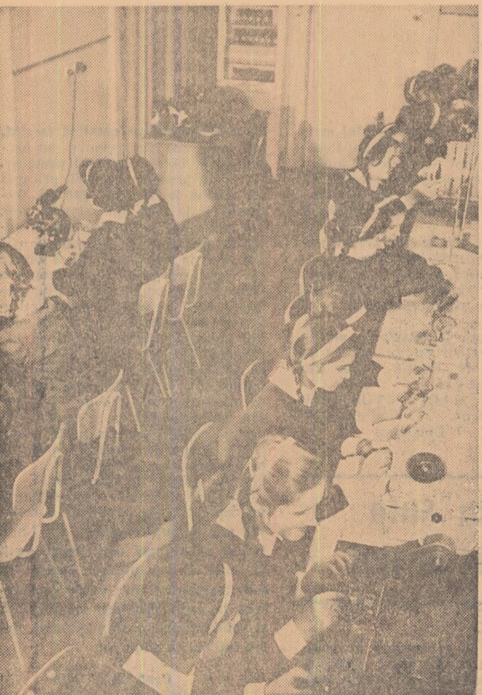
În laboratorul de analize textile a Centrului școlar profesional și tehnic, Timișoara.