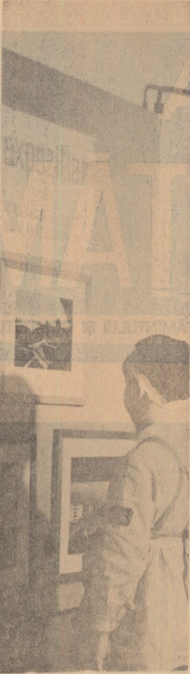
În programul educativ, vizita la muzeu este un moment important.