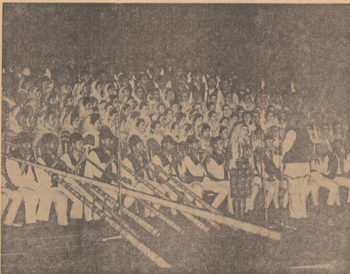
Corul Căminului cultural din Domnești, raionul Curtea de Argeș.