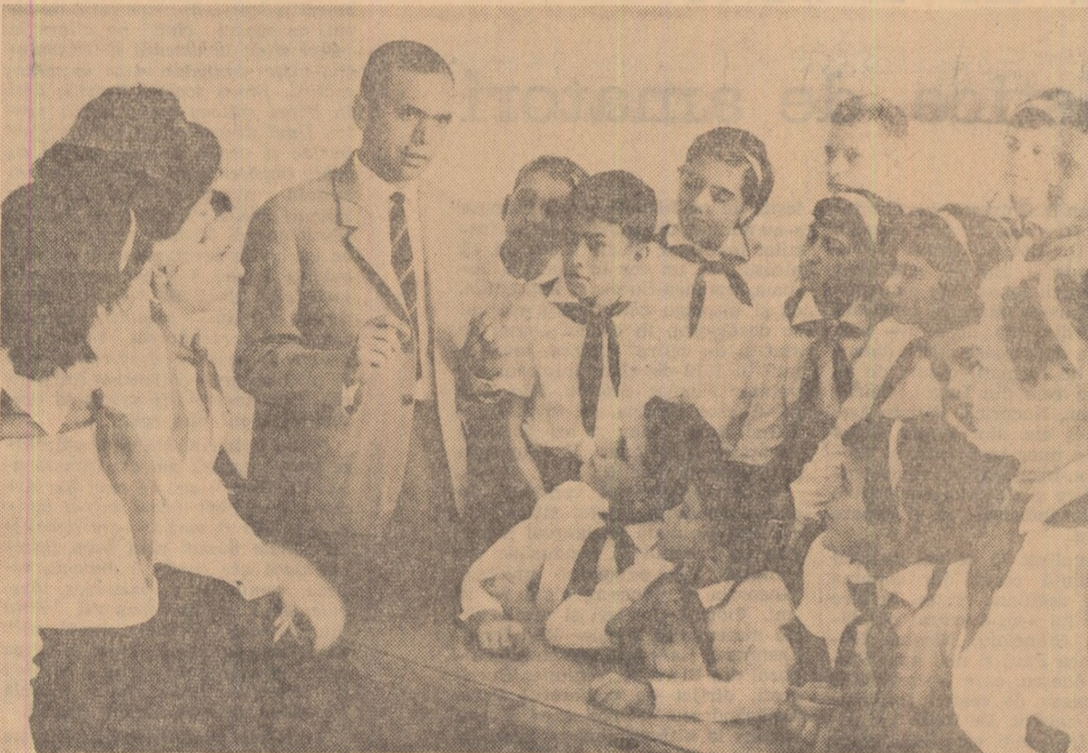
Pionierii la Școala nr. 150 din Capitală se sfătuiesc cu comandantul lor.