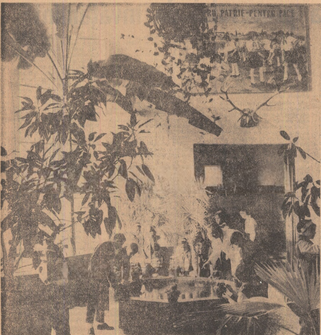
La stațiunea micilor naturaliști de la Palatul pionierilor din București