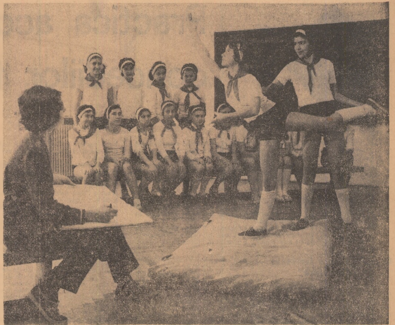
Oră de gimnastică la Școala generală nr. 120 din Capitală

Abonamentele se fac prin difuzorii de presă, factorii poștali și oficiile poștale.