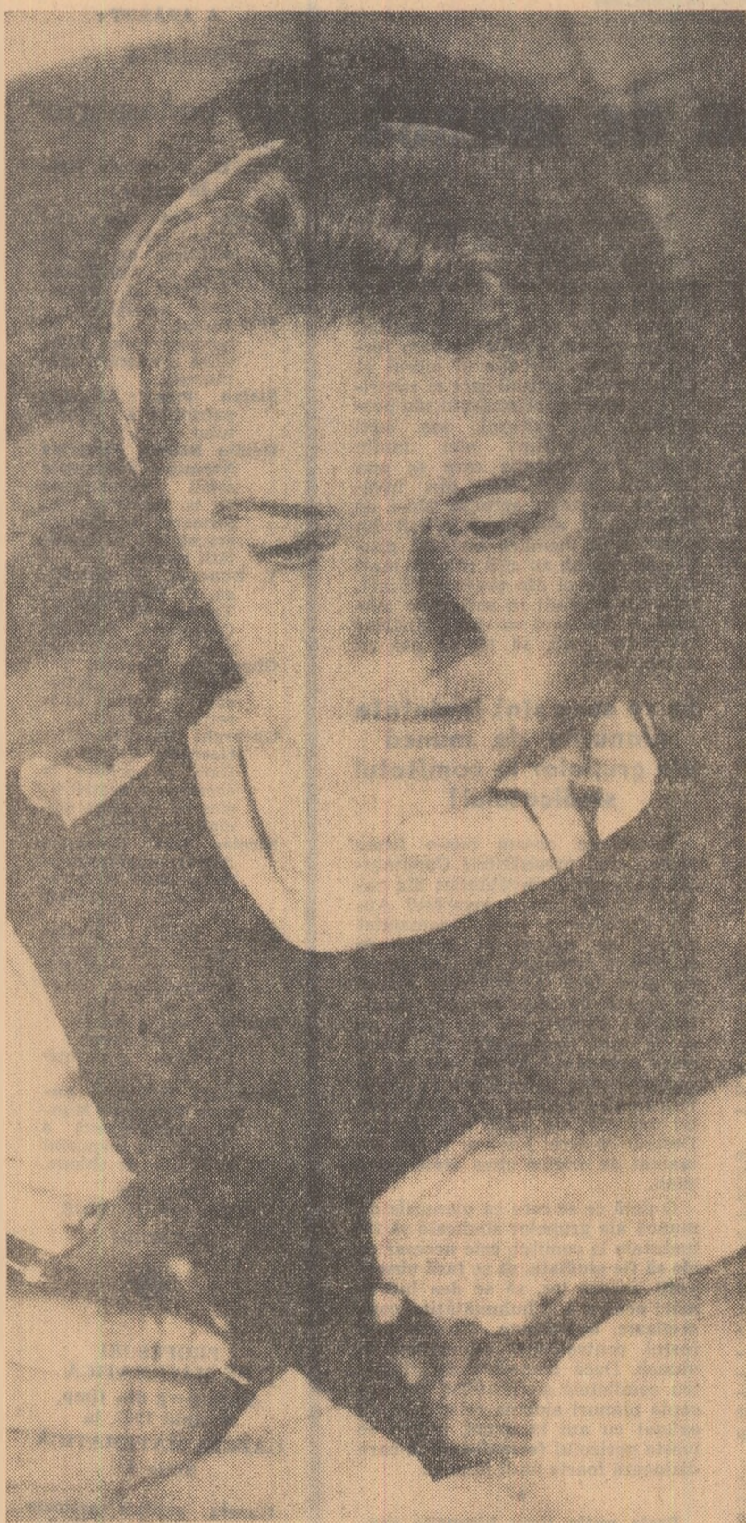
Eleva Florica Pogon din Itia-Deva — model de disciplină și de știință la învățătură