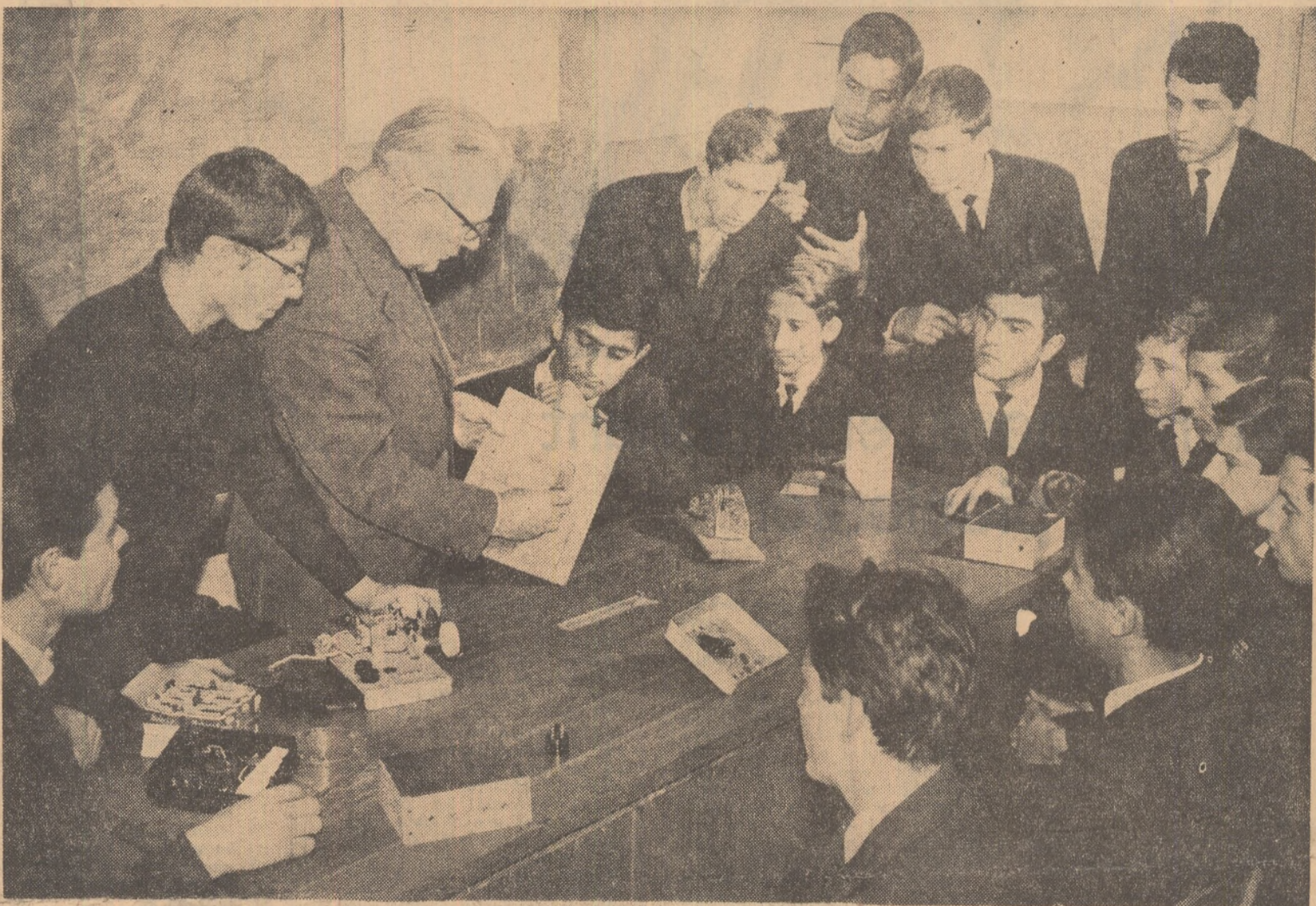
Lucrări de radiofonie la Liceul nr. 4 din Bacău