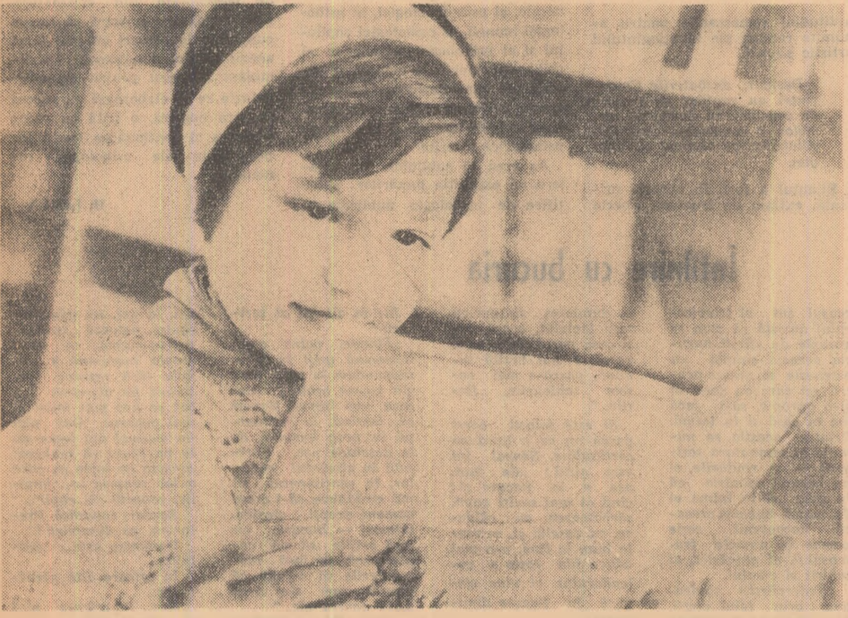
Să-i facem pe copii să îndrăgească lectura încă din clasele mici.