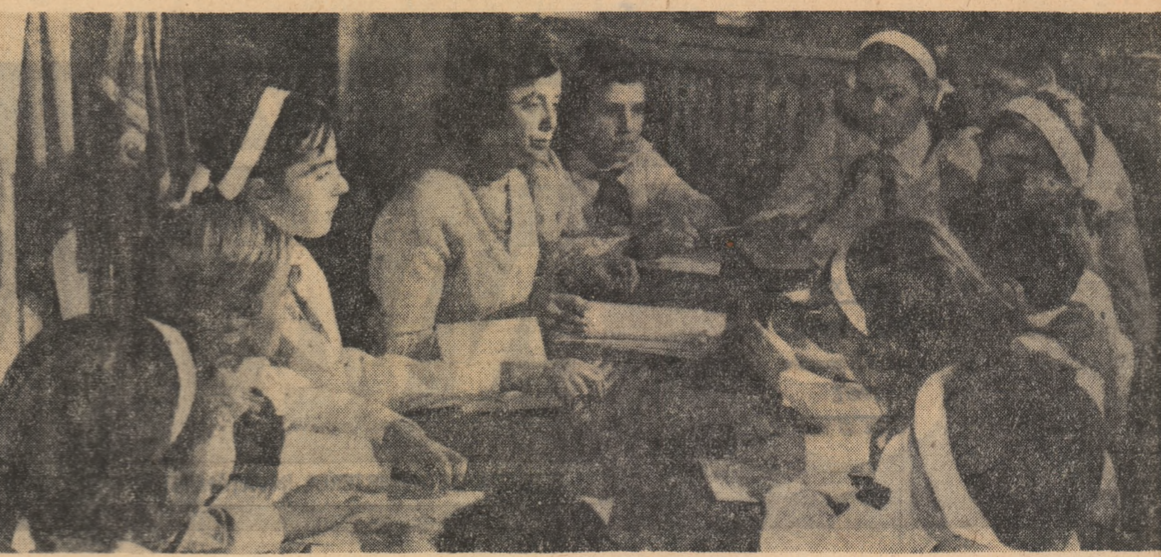
Schimbul de opinii duce întotdeauna la organizarea unor acțiuni atractive

N. Ceaușescu: Partidul Comunist Român — continuator al luptei re-