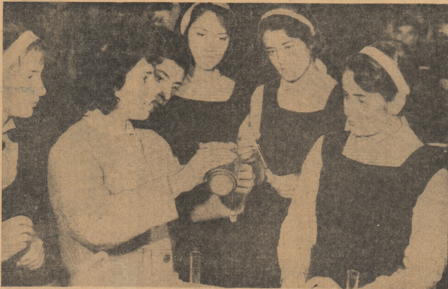
Lecție demonstrativă în laboratorul de chimie al Liceului „Ion Slavici” din Panciu, regiunea Galați.