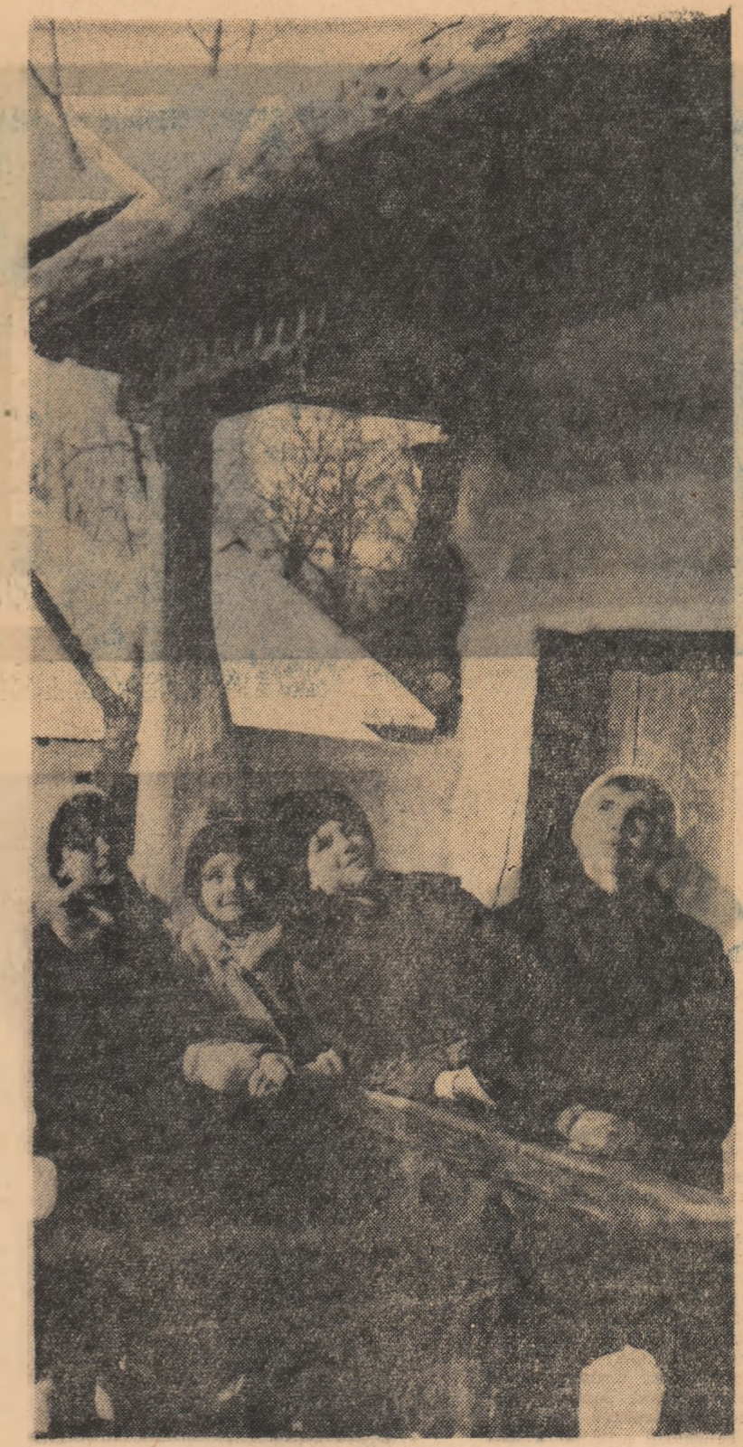
În vizită la Muzeul Satulul