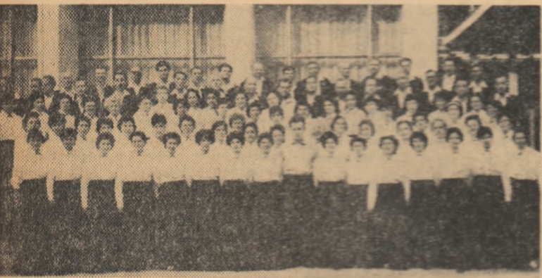
Corul sindicatului învățământ din Craiova