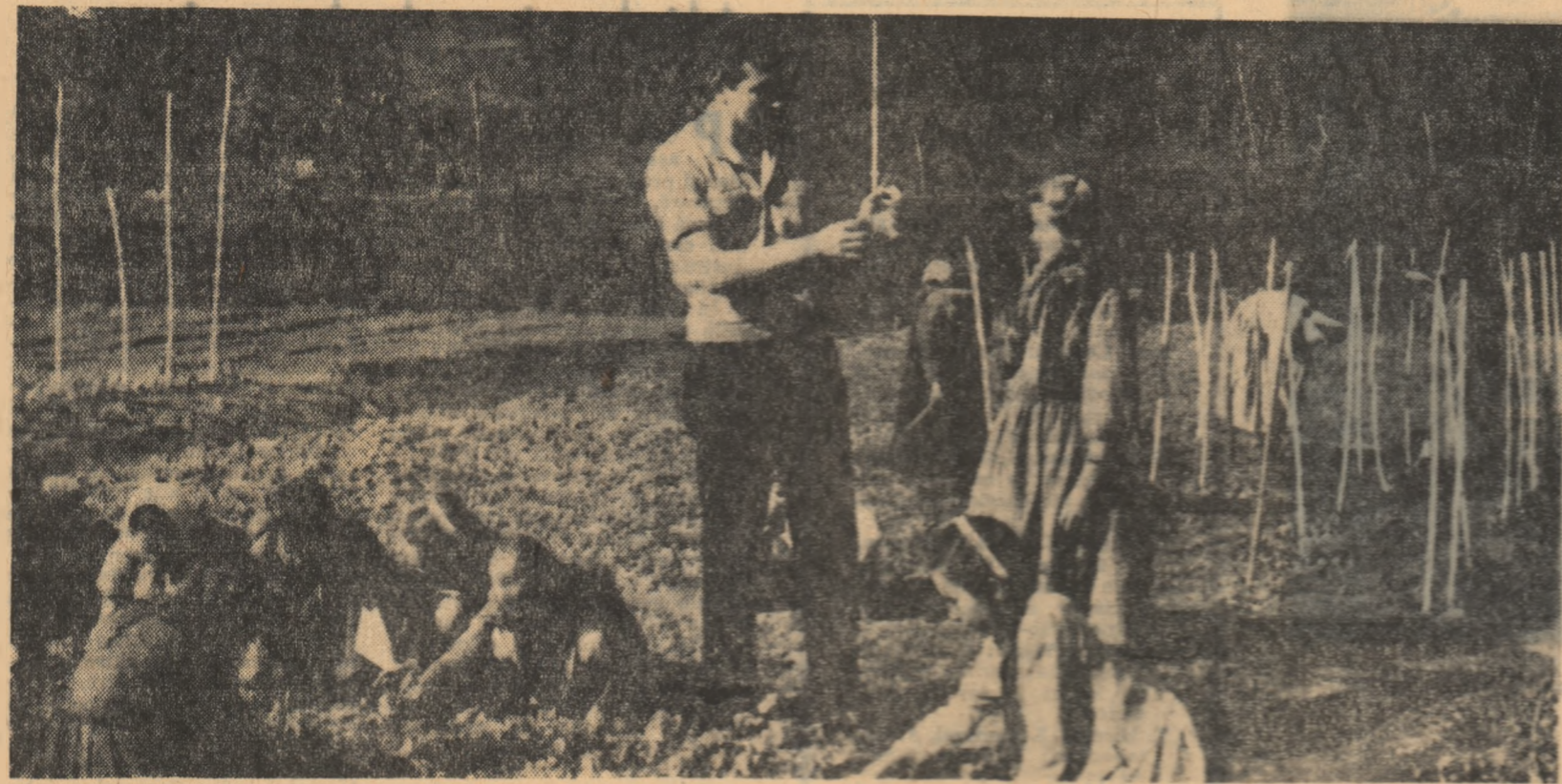
Activități practice pe lotul demonstrativ

Prof. GR. GHEBA afirmă că termenul „conflict” nu este propriu în cazul dat. Există de fapt în elevul adolescentin tendința de a deveni independent și, mai ales, de a-și judeca singur opiniile. Profesorul, prin urmare, nu are fel de persoană „tăbăc”, începe să fie judecat și să se despartă de el. Dacă nu are o părere critică, crează numai o impresie de indiferență față de elev, care are propriile sale păreri, propriile sale soluții. Dacă nu are în seamă aceste aspecte, dacă le răspundem cu ironie, atunci, de se nasc divergențe între cadru și clasă, se poate ajunge la un conflict.