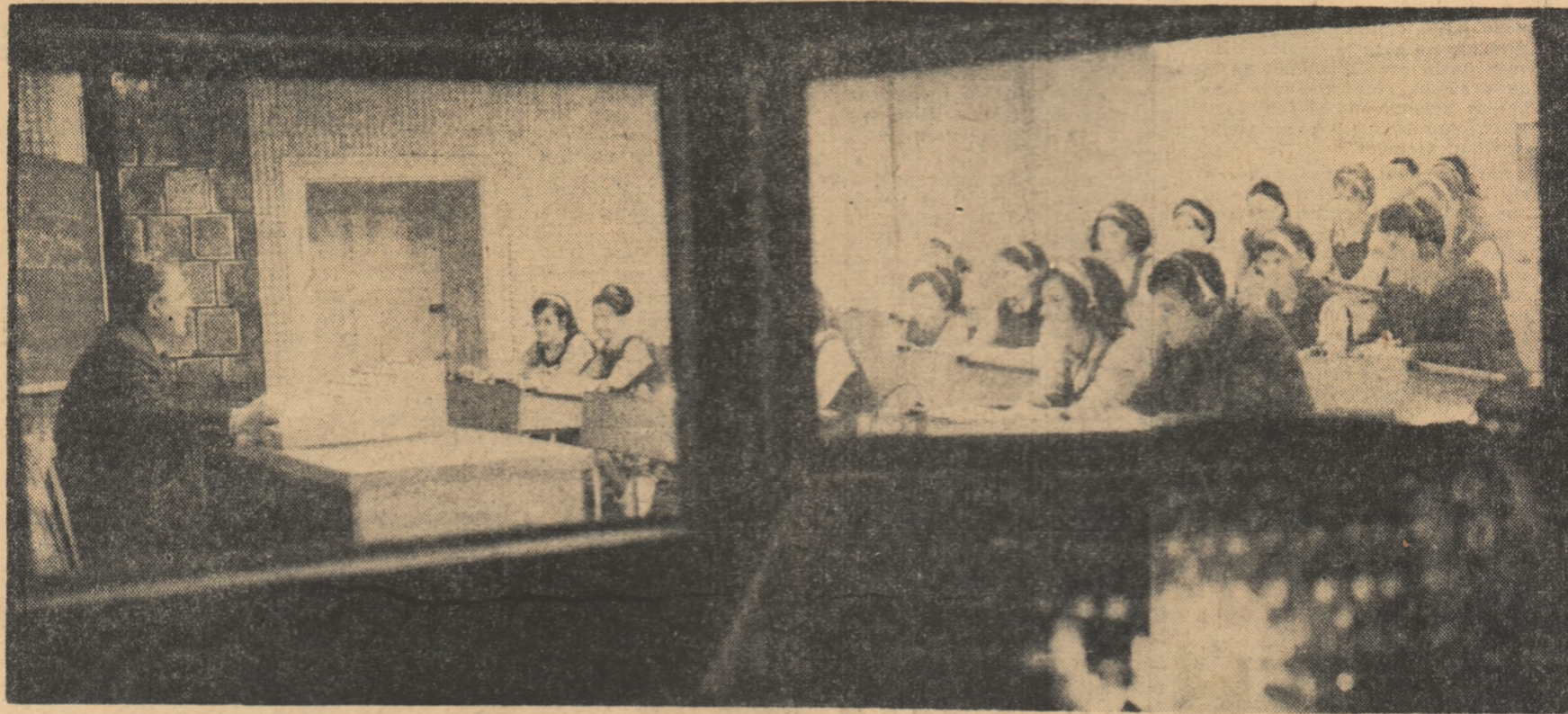
In laboratorul fonetic, realizat cu mijloace proprii, la Liceul nr. 4 din Oradea.

In scopul de a stimula capacitățile, aptitudinile și talentele elevilor și de a le forma deprinderi de cercetare și creație, la Liceul nr. 2 din Caracal a avut loc o reuniune în care s-au prezentat cele mai valoroase lucrări efectuate în cadrul cercurilor pe obiecte. Aria tematică a acestora — „Ultrasunetele”, „Semiconductorii și aplicațiile lor în tehnică”, „Dezvoltarea noțiunii de loc geometric”, „Sinteza în chimia organică modernă”, „Tradiție și inovație în poezia contemporană”, „Aspecte sociale în lirica romantică”, „Simfonismul lui Beethoven” etc. atestă multilateralitatea preocupărilor elevilor. În același timp, conținutul unora dintre lucrări a relevat o serioasă documentare, precum și capacitatea celor care le-au alcătuit de a trata în adâncime unele probleme.