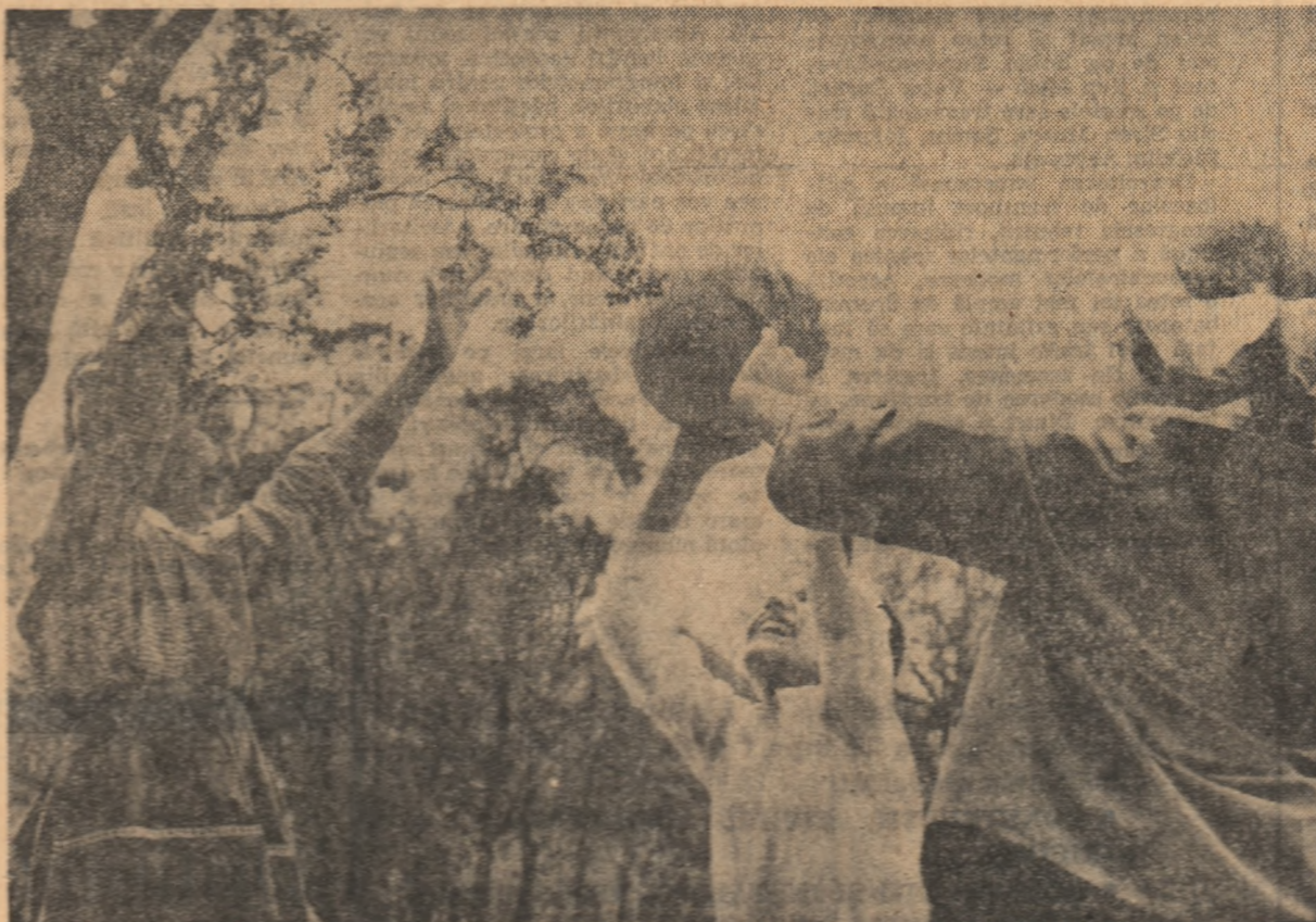
„Ce poate fi mai plăcut decît un joc cu mîșca pe marginea pădurii?”

Lucrările elevilor prezentați la concurs pot oferi un material deosebit de concludent pentru o gamă largă de probleme. Ele pot constitui o anchetă de mari proporții, ale cărei concluzii trebuie să convingă pe cei răspunzători de calitatea pregătirii elevilor că le revine, cît mai urgent, datoria să caute și să găsească soluțiile ce se impun.