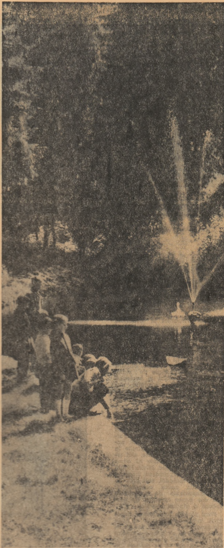
În fața oglinzii de cristal a lacului

parte la programul artistic, pregătind în acest scop un program special“. Manifestări similare vor fi organizate și de sindicatele din învățământ ale celorlalte raioane ale orașului București. Cu mult entuziasm se pregătesc să prezinte programe cele mai bune formații artistice ale școlilor din raioanele „1 Mai“ și „16 Februarie“. Un spectacol festiv care se anunță deosebit de interesant pregătește Clubul sindicatelor din învățământ din orașul București. La acest program își vor da concursul, printre altele, orchestra de muzică populară a cadrelor didactice din Capitală, precum și corul de copii al sindicatelor învățământ. Continuând tradiția organizării unor bogate manifestări artistice cu prilejul „Zilei învățătorului“, sindicatele învățământ din Brașov, Sibiu, Botoșani, Timișoara, ca și din alte numeroase orașe ale țării, acordă toată atenția organizării într-un cadru cât mai festiv a sărbătorii prin care este cinstit corpul profesoral.