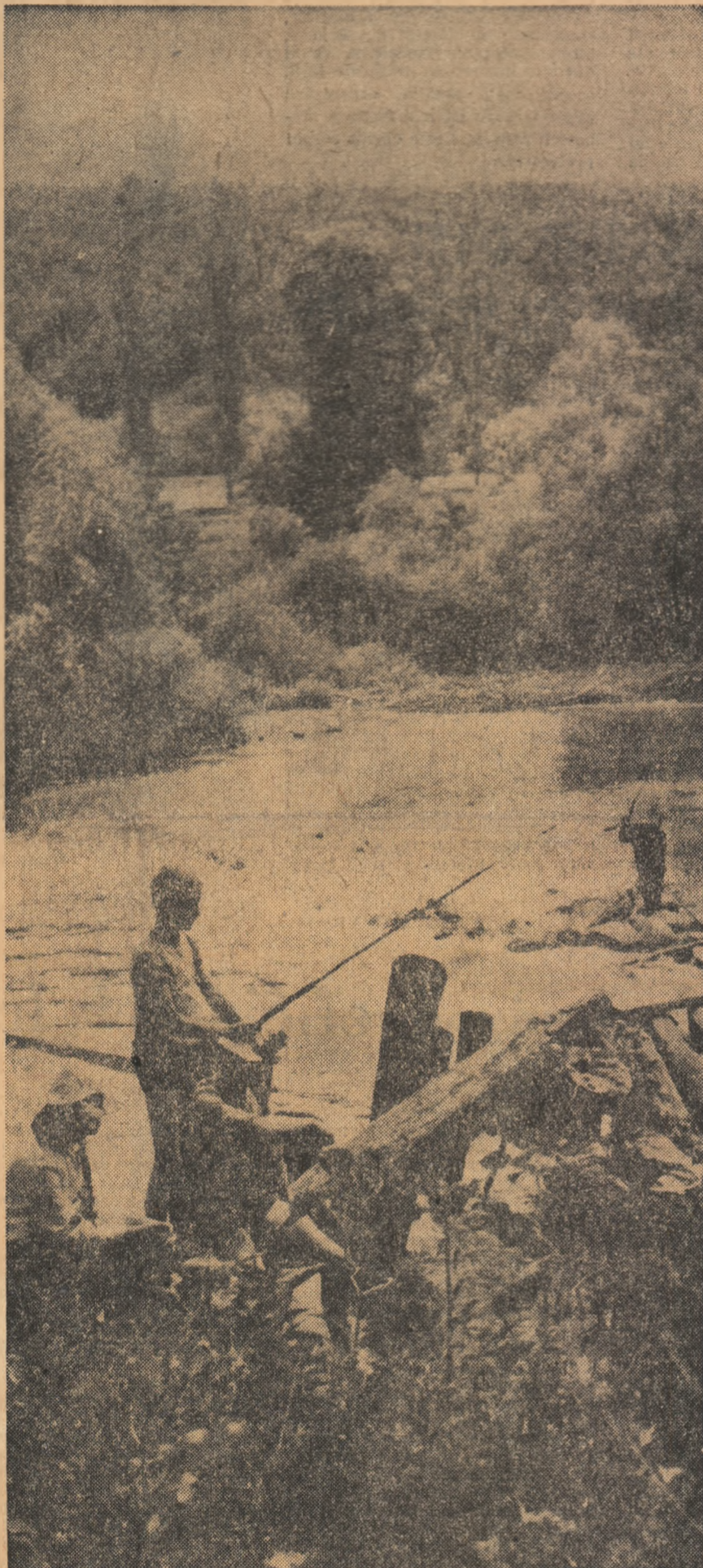
Emoția pescarilor amatori e mare: se prinde pește sau nu?