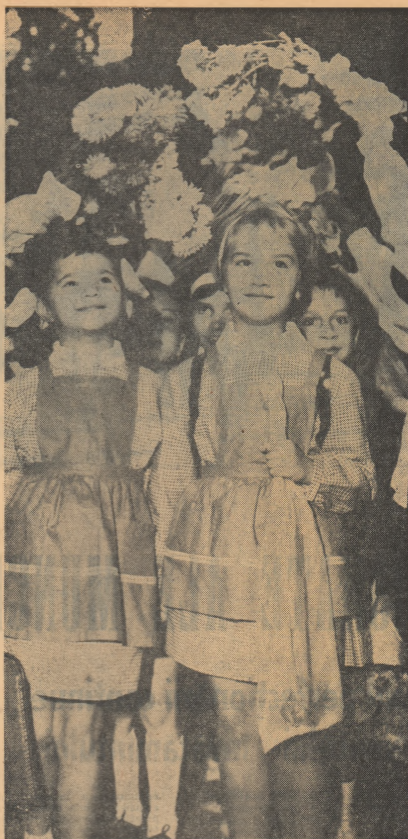
Flori... hărți... Început de toamnă, început de an școlar.

Se îmbogățeste mereu baza materială a școlilor. Iată o situație ilustrativă din raionul Negru Vodă. Peste 400.000 lei au fost alocați aici pentru mobilier școlar nou. 600.000 lei reprezintă valoarea manualelor difuzate în școlile raionului spre a fi dăruite elevilor în prima zi de școală. În același timp, se extind mereu spațiile de învățământ. La 15 septembrie vor intra în funcțiune 15 noi săli de clasă, dintre care două la Cobadin, trei la Cumpăna, două la Plopeni și două la Hagieni.