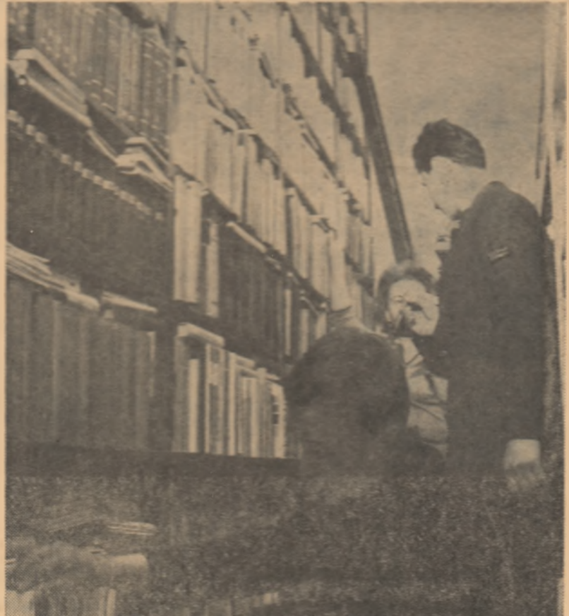
În vacanța bibliotecile școlilor au făcut noi achiziții. Elevii sînt nerăbdători să le citească.

Ora de începere și de încheiere a programului de lucru se stabilește de către conducerea școlii, ținîndu-se seama de normele legale în vigoare, de cerințele și de specificul procesului instructiv-educativ din unitățile respective.