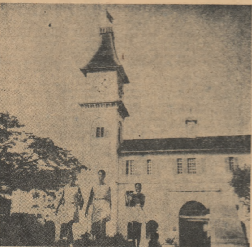
Școală din Ghana