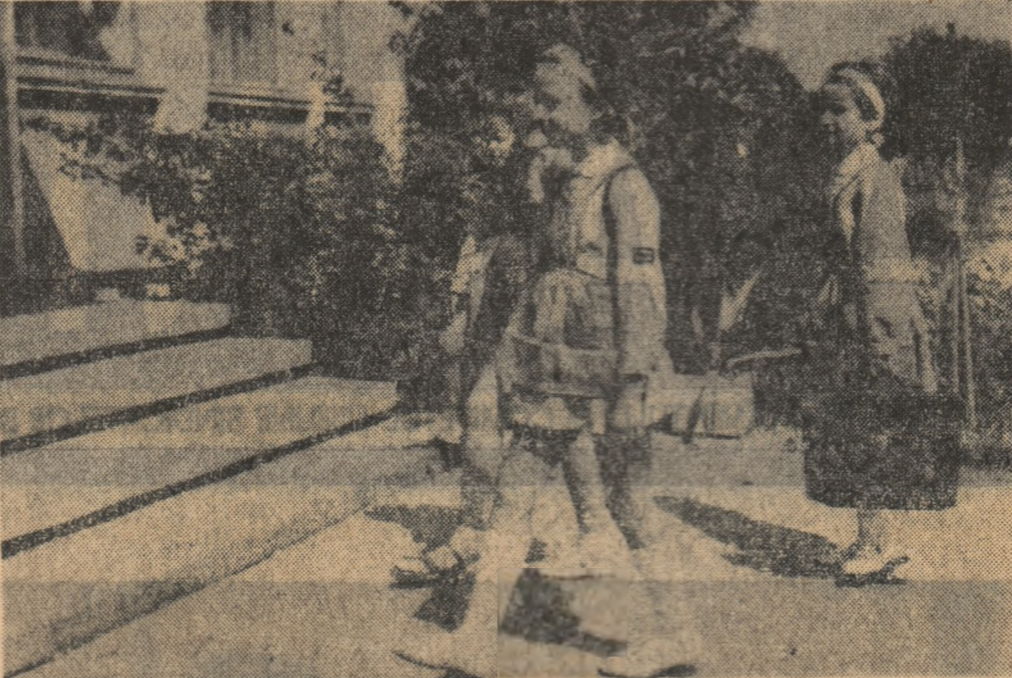
Primii pași, primele descoperiri pe căile învățării.

Converbirile avute în legătură cu reglementarea programului de muncă ne-au creat convingerea că directorii de școli vor veghea cu toată grija la justa aplicare a ordinului ministrului.