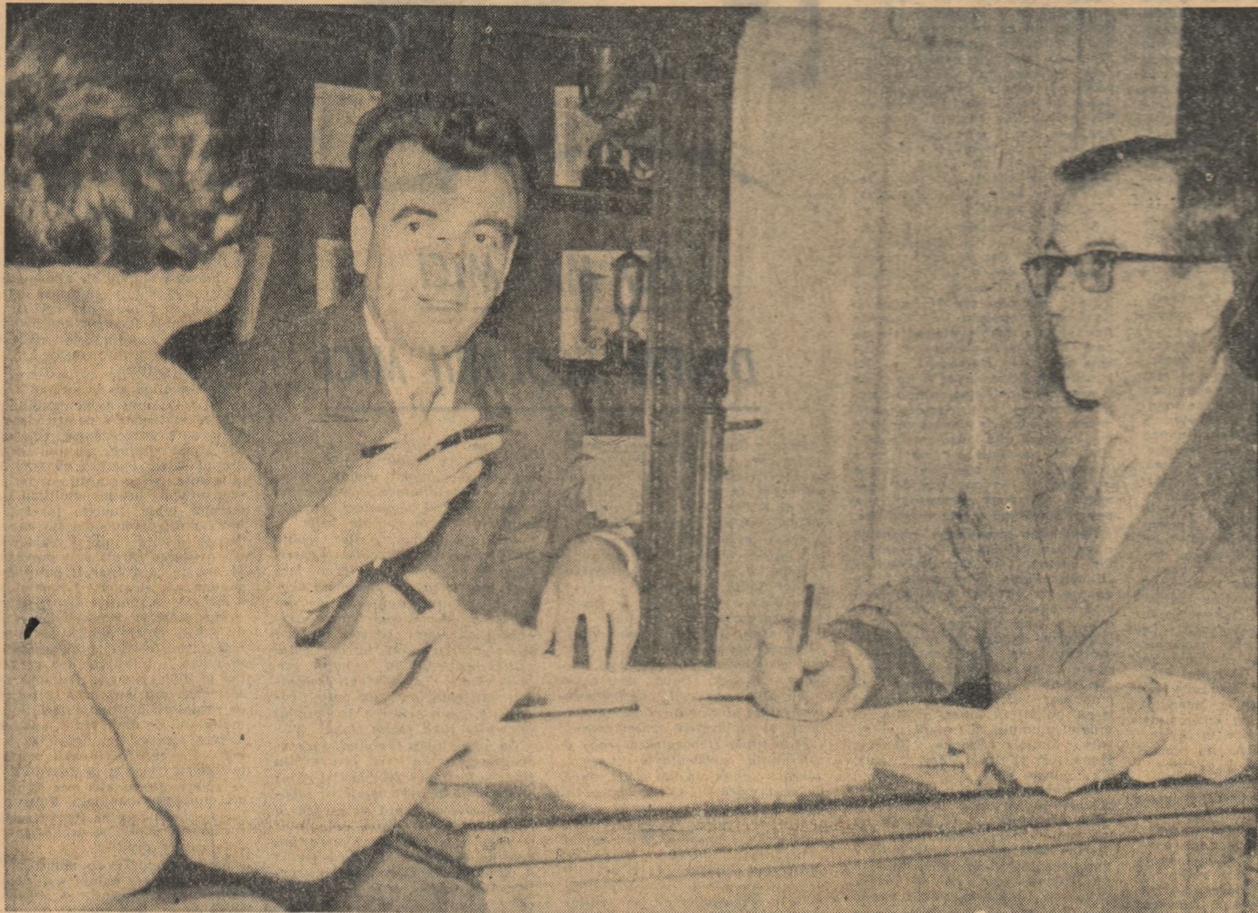
In colectivul de conducere al Liceului „I. L. Caragiale” din București s-au dezvoltat măsurile concrete menite să ducă la creșterea nivelului întregii munci instructiv-educative. Cuvântul de ordine — fiecarei acțiuni eficiență maximă

EDITATĂ DE MINISTERUL ÎNVĂȚĂMÎNTULUI ȘI COMITETUL UNIUNII SINDICATELOR DIN ÎNVĂȚĂMÎNT ȘI CULTURĂ