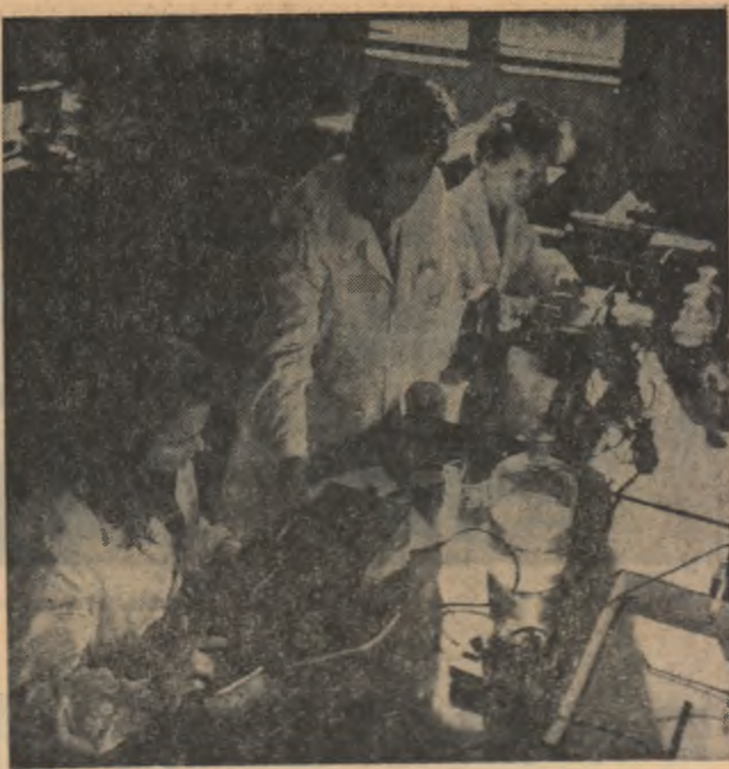
Într-un laborator al Universității Babeș-Bolyai din Cluj.