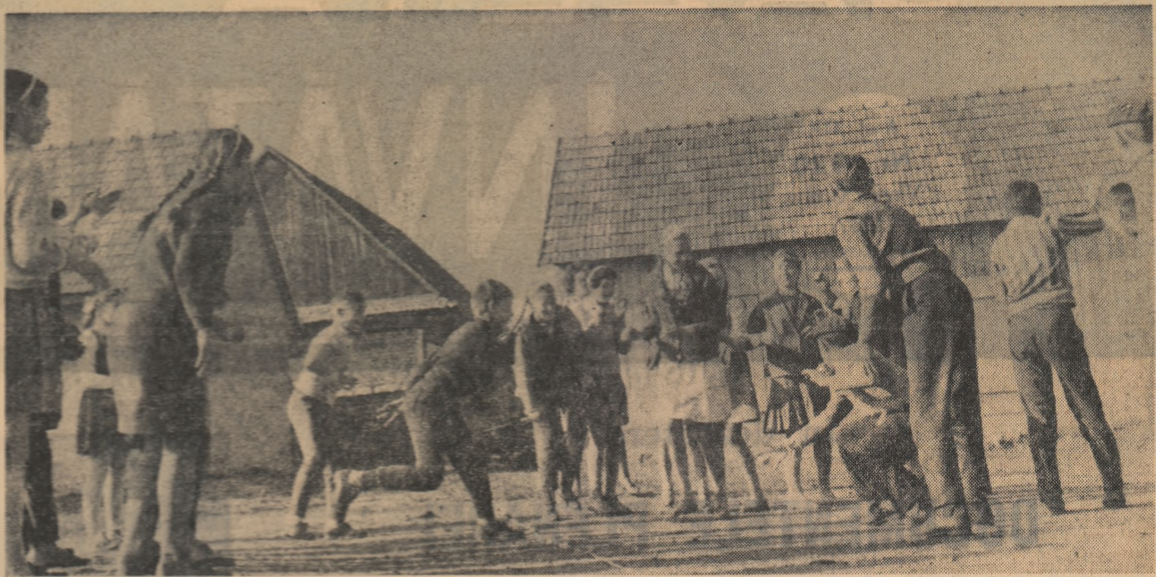
În timpul liber, elevii din școlă se astrează în jocuri de mișcare... Dar de aici și pînă la desfășurarea unor adevărate activități sportive mai este încă un drum lung de străbătut.

Prof. I. V. MAȘTEI 1) Cantor a definit numărul irațional ca limita unui șir convergent de numere ratiionale. La baza definiției lui Dedekind stă următoarea observație: orice număr ratiional împarte numerele ratiionale în două clase. Într-o clasă sînt numerele mai mici ca alfa iar în cealaltă mai mari ca alfa. Analog se definește și numerele iraționale, cu ajutorul așa-zimutelor tăieturi Dedekind. Definiția prin intermediul tăieturilor Dedekind însă nu este, după părerea mea, accesibilă elevilor din clasa a XI-a.