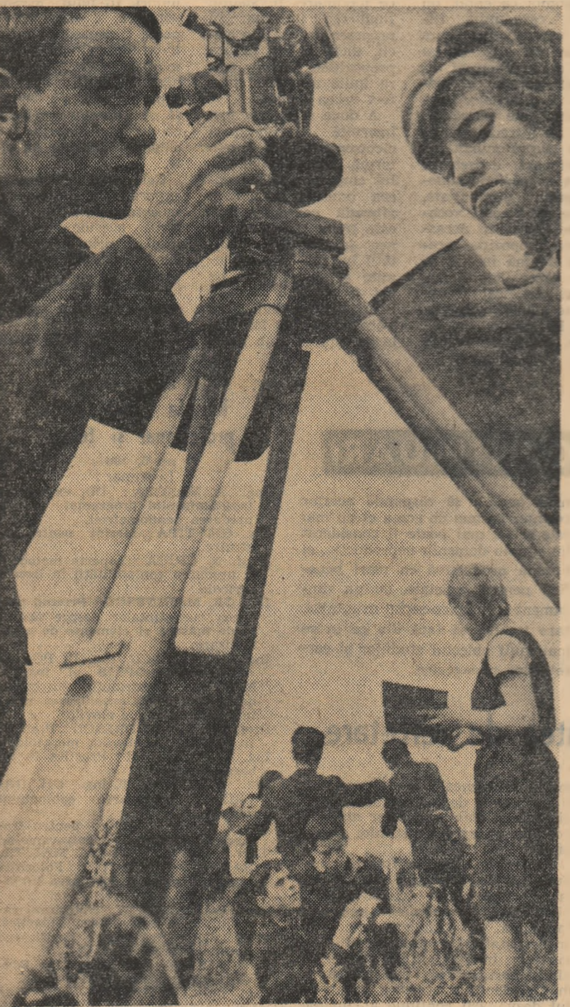
Oră de topografie la Liceul agricol din Iași.