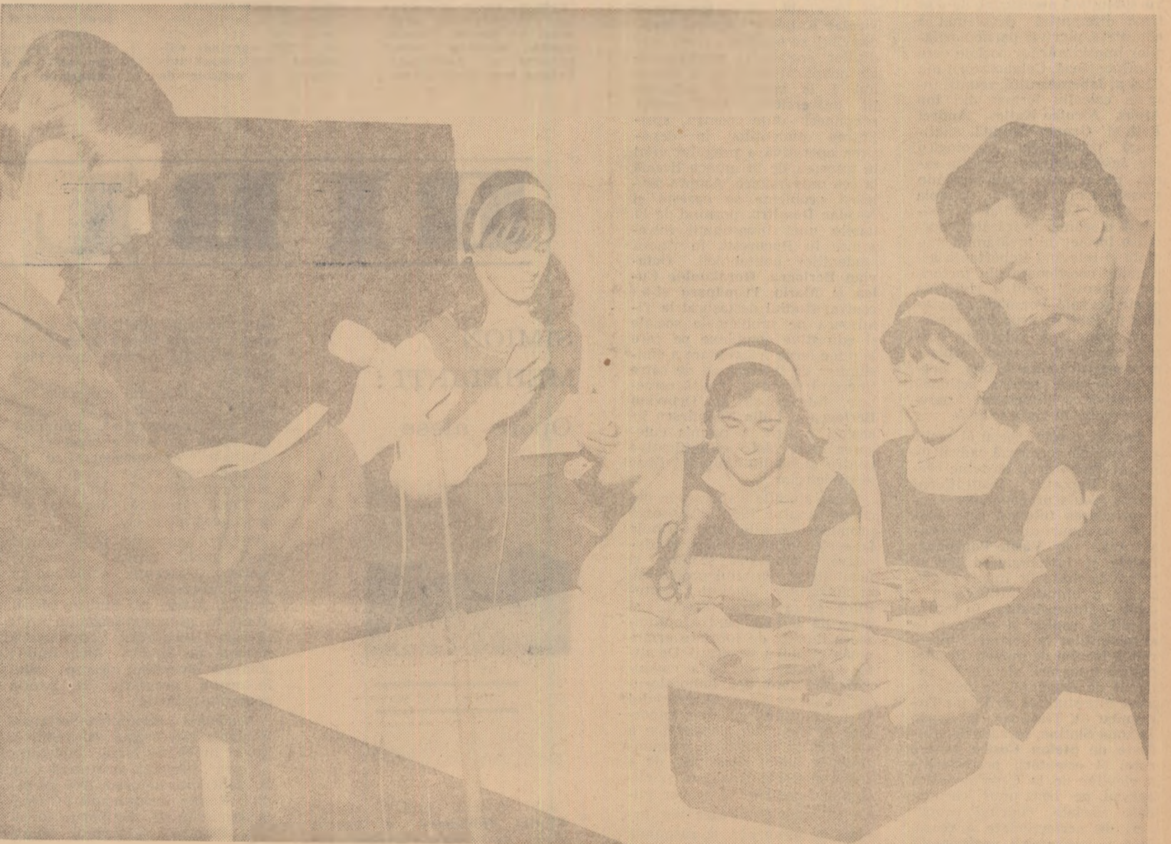
Atenție transmitem! Aici stația de radioamplificare a Liceului nr. 38 din București.