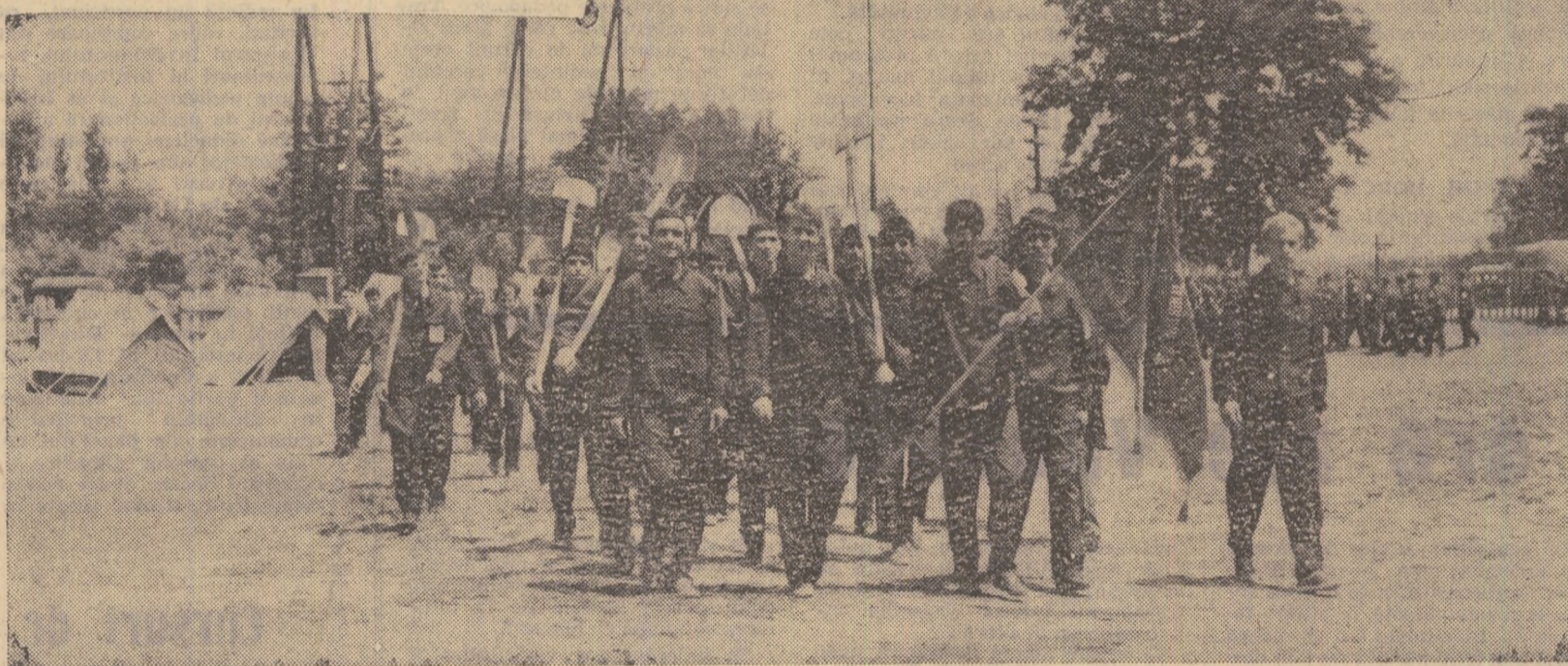
Brigada de elevi a Liceului „D. Bolintineanu” din București pornind la lucru