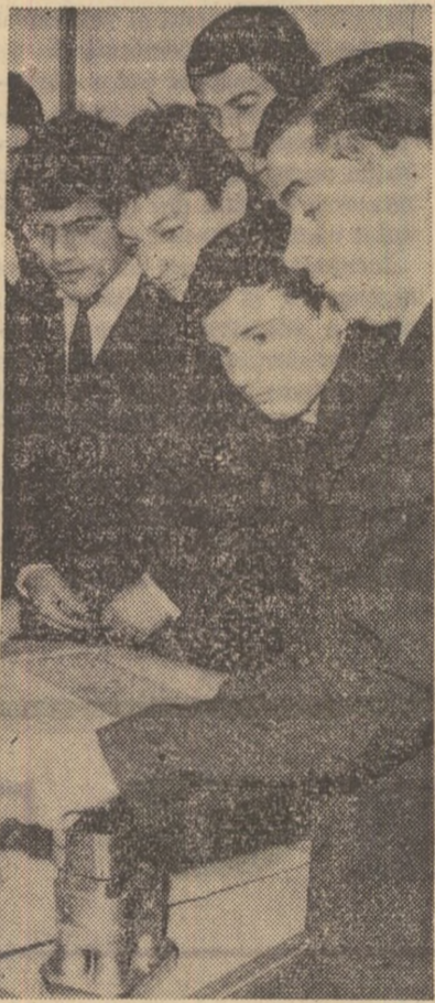
Activitatea practică dezvoltă gîndirea creatoare