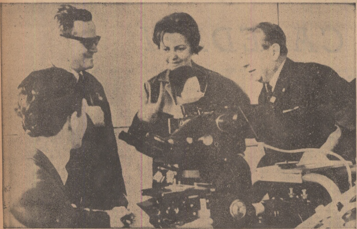
Microscop perfecționat prezentat în sectorul „Învățământ și cercetare științifică” al pavilionului românesc de la Târgul internațional din Leipzig