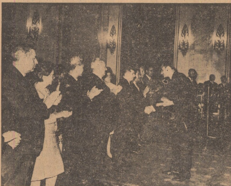
(Continuare în pag. a 3-a)

(Cuvîntarea a fost subliniată cu aplauze puternice, entuziaste).