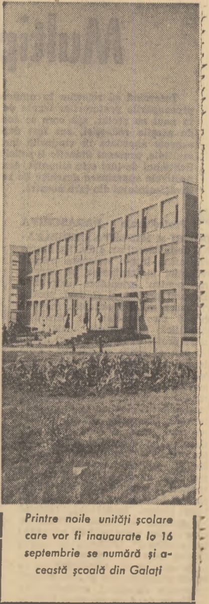
Printre noile unități școlare care vor fi inaugurate la 16 septembrie se numără și această școală din Galați