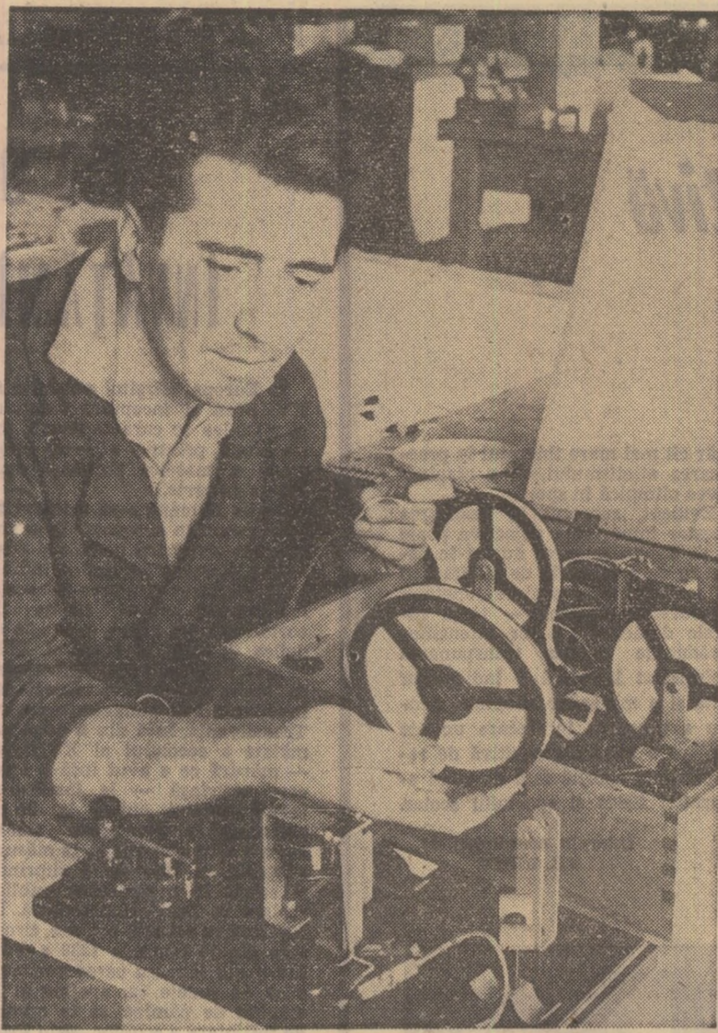
Neîntrerupt, în această perioadă, pornesc din atelierele I.M.D. către școli diferite aparate didactice menite să contribuie la modernizarea predării.

Tot o creație a acestui an este și Școala profesională de construcții din Sfântul Gheorghe, în care vor pătrunde tinerii ce doresc să se califice în meseriile de tâmplari de mobilă și articole tehnice, electricieni pentru instalații de forță și lumină, mozaicari-faianțari instalatori pentru instalațiile tehnico-sanitare. Școala aceasta va prelua și va duce mai departe, amplificând-o, o veche tradiție a meștegurilor covășene, în domeniul construcțiilor. Căci aici au existat, de sute și sute de ani, meșteri pricepuți în înălțarea clădirilor și turnurilor de cetate, în arcuirea și sculptarea lemnelui de mobilă. Corpul didactic al noii școli, format din specialiști cu înaltă calificare, atelierele și laboratoarele acestora, siruința elevilor vor con-