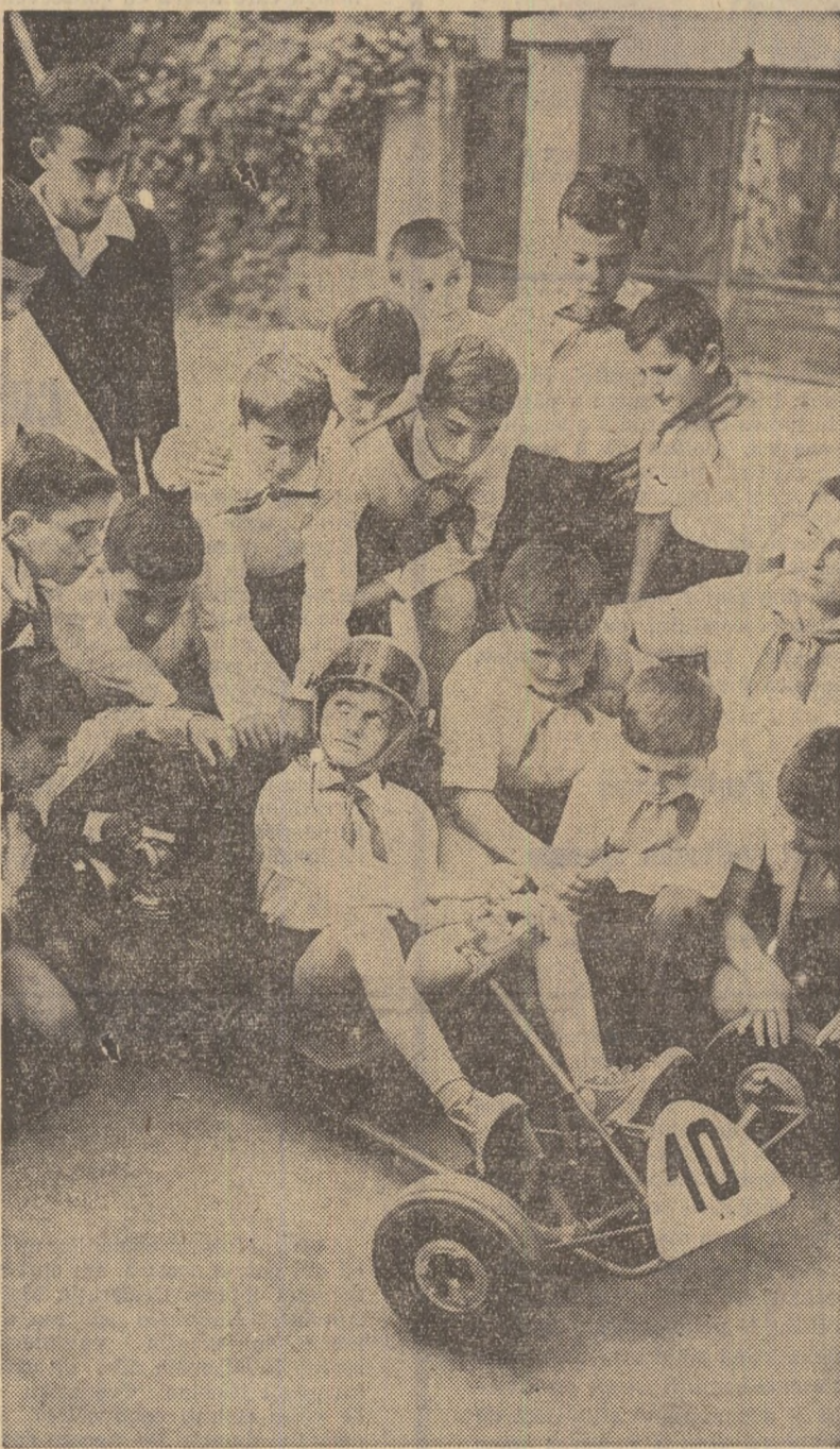
Un sport care îmbină îndemnarea, curajul și priceperea tehnică — car-tingul — cîștigă tot mai mult teren în rîndurile tineretului școlar