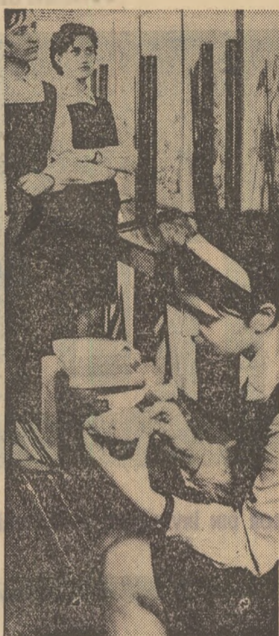
De luni, din nou împreună