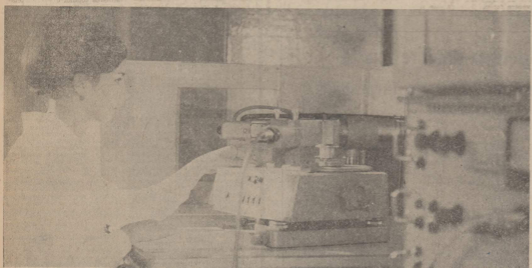
În laboratorul de cercetări al Universității din Timișoara: măsurători în raze X.

VALORIFICAȚI STICLELE ȘI BORCANELE GOALE LA MAGAZINELE ALIMENTARE, LA CENTRELE DE ACHIZIȚIE SAU LA ACHIZITORII CARE VĂ VIZITEAZĂ LA DOMICILIU