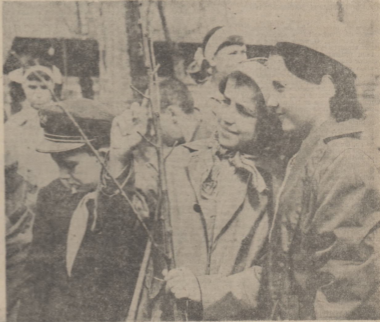
Mii și mii de școlari de la orașe și sate au dedicat „Săptămîni primăverii” numeroase acțiuni patriotice. Cîteva ore pe zi au implinit liceele și voințele, au săpat gropi pentru puieți, au curățat pomii, pregătindu-le hrana de primăvară, cu luat în stăpînire curțile și grădiniștile școlilor, spațiile verzi din orașe și satele natale și le-au croit alei și straturi noi, au îngrijit monumentele, au construit sau au curățat culturi pentru păsări. Într-un cuvînt, peste tot au făcut treabă bună. Aceste zile au constituit nu numai un prilej de întîlnire cu natura, care le-a oferit atîtea bucurii, dar și un examen al priceperii lor de gospodari, pe care l-au trecut cu succes.