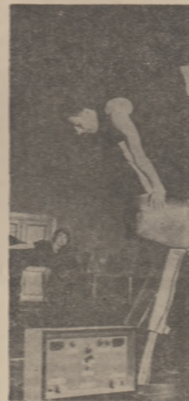
La I.E.F.S. București a fost inventat un aparat electronic care semnalizează greșelile în efectuarea exercițiilor de gimnastică