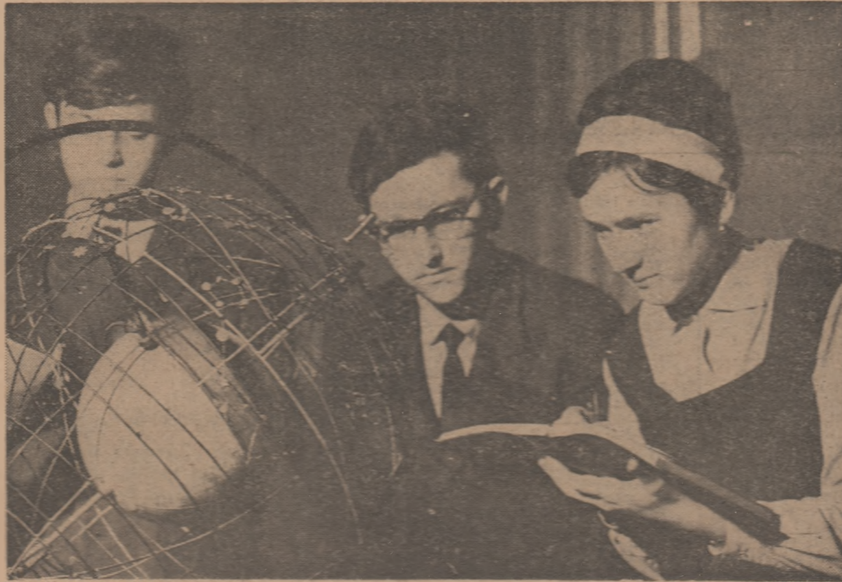
Elevi din clasa a XII-a de la Liceul nr. 1 din Bistrița recapitulînd o lecție de astronomie