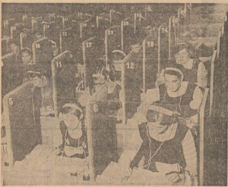
În laboratorul lingvistic al Liceului Nr. 2 din Rădăuți