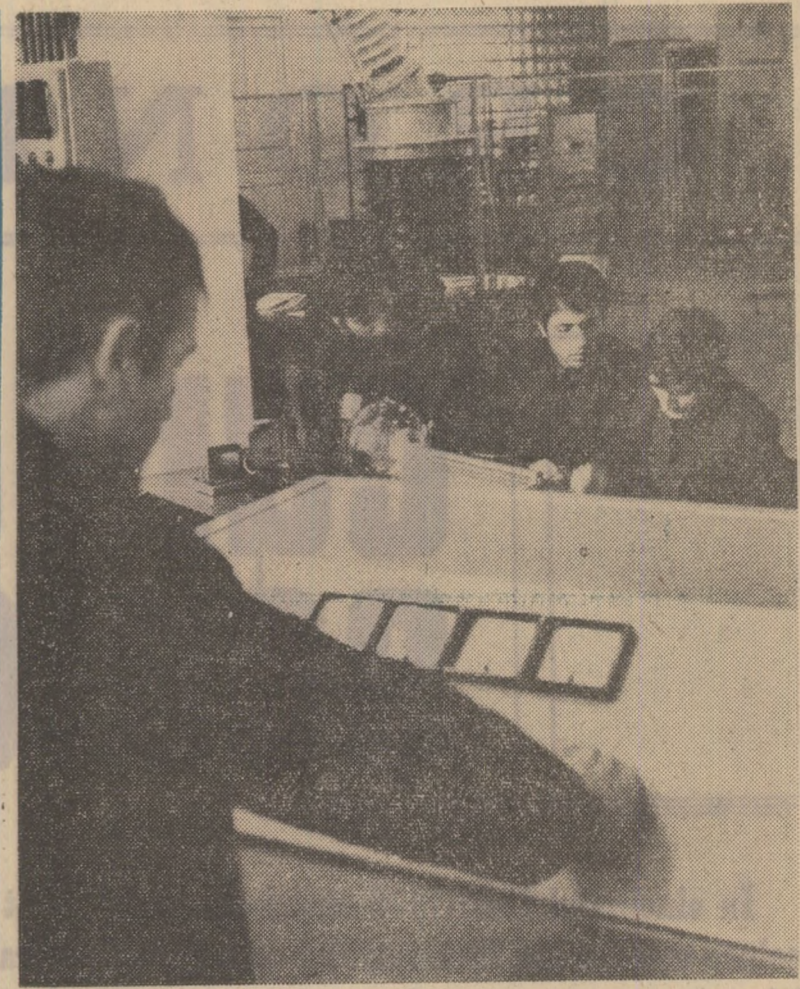
În laboratorul de tensiune înaltă al Universității din Craiova

În regiunea Ispahan metoda funcțională se aplică în 1.400 de clase de adulți și sînt în curs de pregătire 1.400 noi învățători.