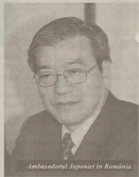
Ambasadorul Japoniei în România

Obligativitatea vizei va rămâne însă în vigoare pentru românii care se vor deplasa în această țară în scopuri profesionale.