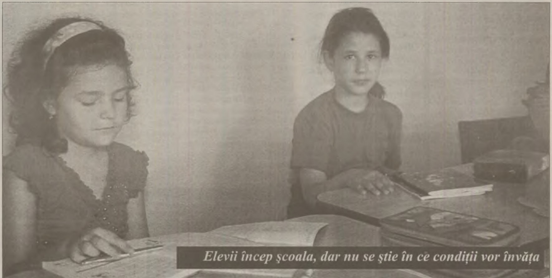
Elevii încep școala, dar nu se știe în ce condiții vor învăța

Și de această dată anul școlar a venit „pe nepregătite”. Clădirile în care urmează să se desfășoare procesul de învățământ nu sunt pregătite să-i primească pe elevi. Vacanța mare nu a fost îndeajuns de lungă pentru finalizarea lucrărilor de reabilitare a școlilor din județ. Simion Molnar, inspector șef adjunct la Inspectoratul Școlar Județean Hunedoara spune că sunt 107 clădiri, din cele peste 500 de imobile în care își desfășoară activitatea instituțiile de învățământ din județ, care nu au primit încă avizele de funcționare din partea Direcției de Sănătate Publică a Județului