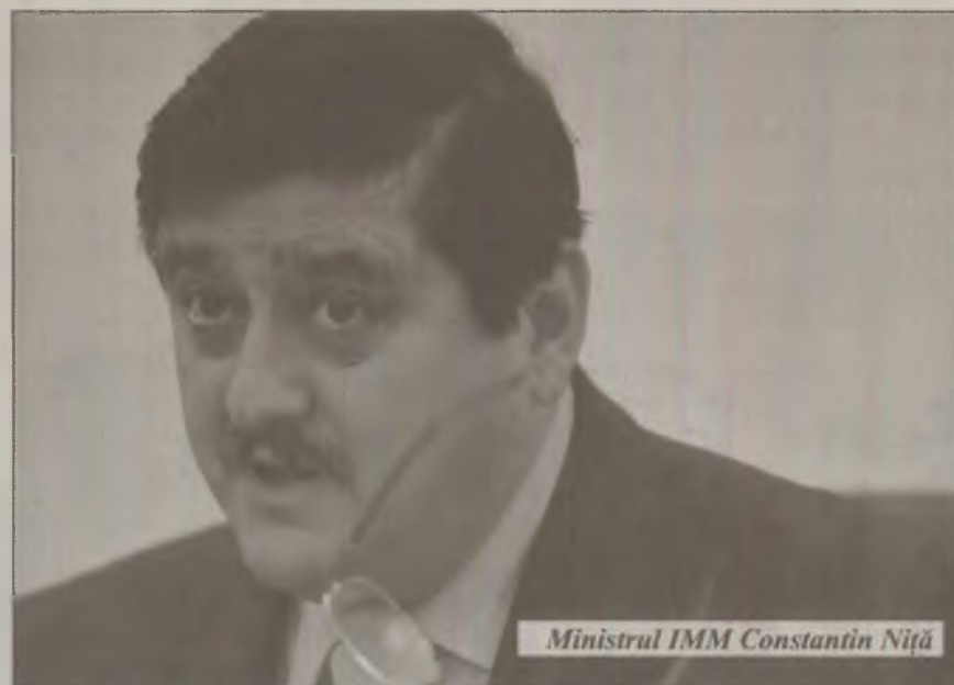
Ministrul IMM Constantin Niță