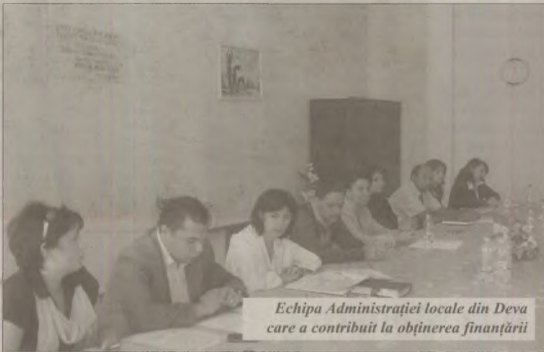
Echipa Administrației locale din Deva care a contribuit la obținerea finanțării

Administrația locală a municipiului Deva a obținut un milion de lei pentru promovarea turistică a Dealului Cetății și a Centrului istoric. Consiliul local Deva a semnat un contract de finanțare pentru această sumă, în cadrul Programului Operațional Regional, din care 822 de mii sunt fonduri nerambursabile, din Fondul European de Dezvoltare Regională și de la bugetul național. Materialele publicitare (bannere, suporturi electronice și pliante) vor fi