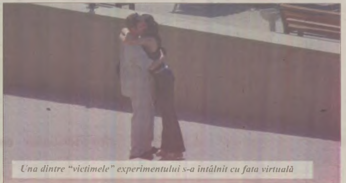
Una dintre „victimile” experimentului s-a întâlnit cu fata virtuală