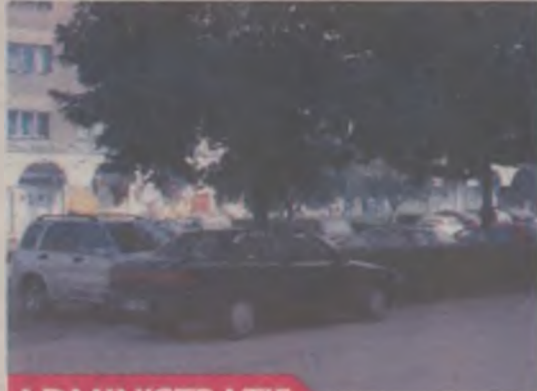
ADMINISTRATIE PAGINA 5

ANUL 1 - NR. 14 - JOI, 1 OCTOMBRIE 2009 - 12 PAGINI - 70 BANI