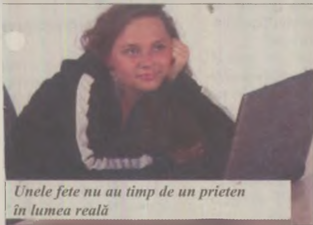
Unele fete nu au timp de un prieten în lumea reală

Profilul unui „vânător de puicuțe” în lumea virtuală ar fi: bărbat între 38 și 48 de ani, căsătorit, cu copii, studii superioare și situație materială peste medie. În general, aceștia își ascund adevărata identitate, postând la profilul personal poze ale altor persoane, luate de pe Internet. Unul dintre apelanți, un cunoscut om de afaceri din Hunedoara, s-a deplasat la ora două noapte cu mașina la Deva pentru o partidă de amor cu tânăra fictivă de pe site, cu toate că aceasta a specificat clar în discuția cu el că nu este dispusă la așa ceva. După ce a stat o jumătate de ora la locul de întâlnire, stabilit tot de el, a plecat furios.