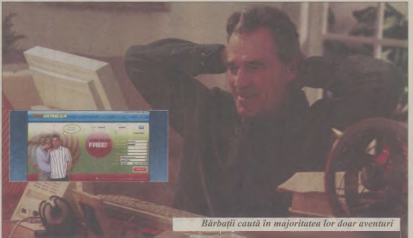
Bărbații caută în majoritatea lor doar aventuri

Site-urile de întâlniri și matrimoniale sunt luate cu asalt de tot mai mulți hunedoreni. Pe cea mai cunoscută pagină web cu acest profil pot fi găsite peste 10.980 de persoane care își declară domiciliul în județul Hunedoara. Dintre acestea, 6.995 sunt femei și – în afară de trei excepții – prostituate care își oferă serviciile domnilor generoși, restul sunt acolo în speranța că își vor găsi marea iubire sau o prietenie adevărată. De partea opusă însă, bărbații care frecventează aceste site-uri sunt aproape în totalitate interesați de satisfacerea poftelor animalice. „Glasul Hunedoarei” a făcut un experiment și a postat pe trei site-uri profilul unei tinere fictive de 18 ani. Rezultatele experimentului au fost dezastruoase pentru bărbații care își petrec timpul comunicând pe chat prin site-urilor de întâlniri. Puștoaica de 18 ani a primit în doar două ore mesaje de la peste 700 de bărbați. Am selectat dintre acestea numai pe cei din județul Hunedoara, au fost în număr de 260, încurajați de faptul că tânăra apărea ca fiind domiciliată în Deva. Dintre hunedoreni doar trei au postat mesaje decente, fără conotații sexuale. Restul de 117 nu au dorit altceva decât o partidă de sex pe viu sau virtuală, cu toate că nici profilul tinerei și nici prezentarea pe site nu lăsau să se înțeleagă că oferă servicii sexuale. Mai mult decât atât, 12 dintre amatorii de senzații tari nu s-au mulțumit cu o dis-