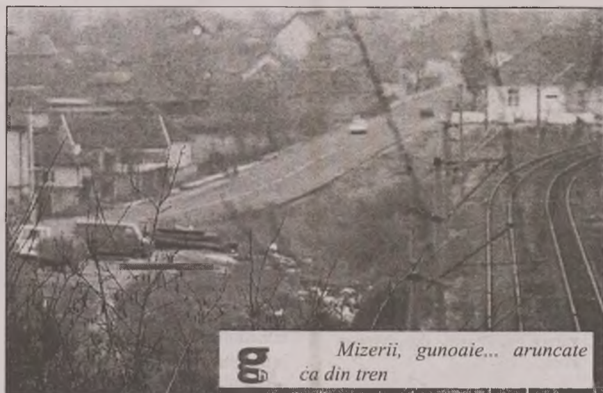
Mizerii, gunoaie... aruncate ca din tren

Un alt aspect al comerțului cu haine second - hand este sortarea hainelor. Agenții economici cumpără de la importatorii direcți cantități impresionante de haine, după care le încarcă în autoturisme sau în tren. Șoferul mai oprește din când în când în câte o parcare pentru a se „odihni”, și ca să nu stea moacă mai sortează din produse. Deșeurile, adică hainele mai ponosite sunt abandonate în parcare sau aruncate din tren, după caz. Astfel, acostamentul drumului și terasamentul de lângă calea ferată din zona aferentă localității Ciopeia sunt veșnic împânzite de vechituri. „Este un adevărat fenomen și cred că s-a dezvoltat și din cauza crizei. Dar asta nu este o scuză. Până în luna decembrie a anului trecut nu am fost nevoiți să luăm măsuri, dar am demarat controale împreună cu poliția economică pentru a vedea unde depozitează comercianții deșeurile. Fenomenul are o amploare deosebită și a devenit o problemă foarte gravă în localitățile Hațeg, Ciopeia, Uricani, Vulcan și Petroșani. Volumul de marfă, care trece prin aceste firme, este foarte mare. Cei care vor fi prinși, că nu pot justifica