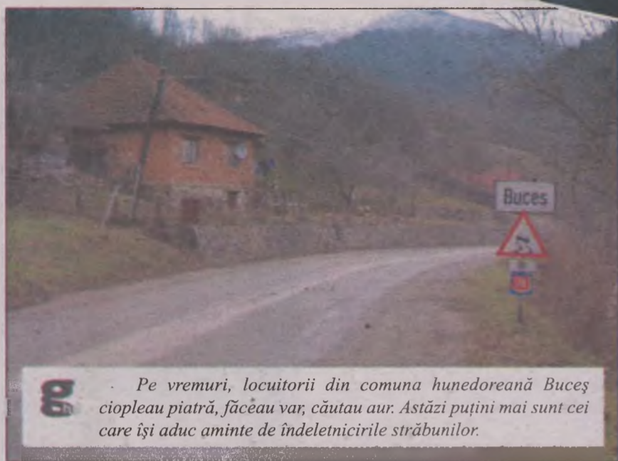
Pe vremuri, locuitorii din comuna hunedoreană Buceș ciopleau piatră, făceau var, căutau aur. Astăzi puțini mai sunt cei care își aduc aminte de îndeletnicirile străbunilor.