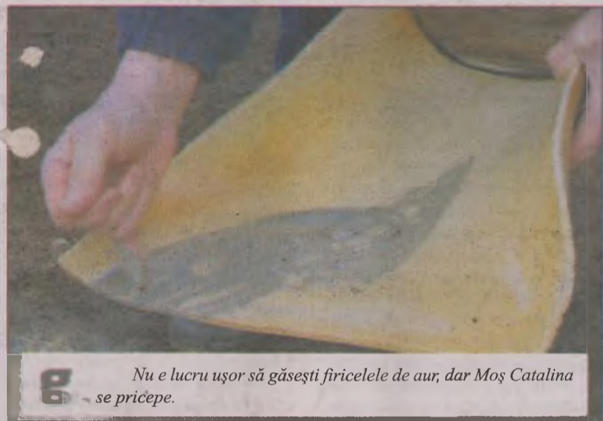
Nu e lucru ușor să găsești firicelele de aur, dar Moș Catalina se pricepe.