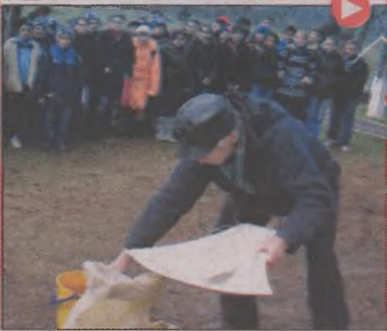
Copiii de la Buceș învață meseria de căutător de aur