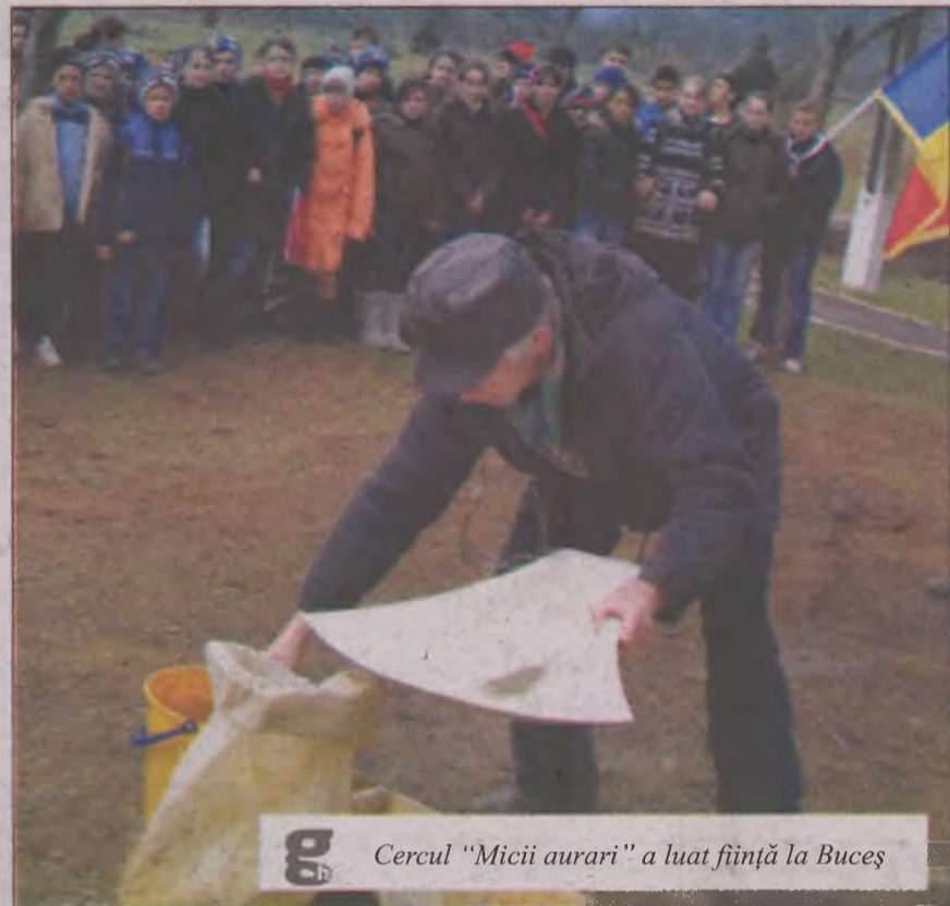
g Cercul "Micii aurari" a luat ființă la Buceș