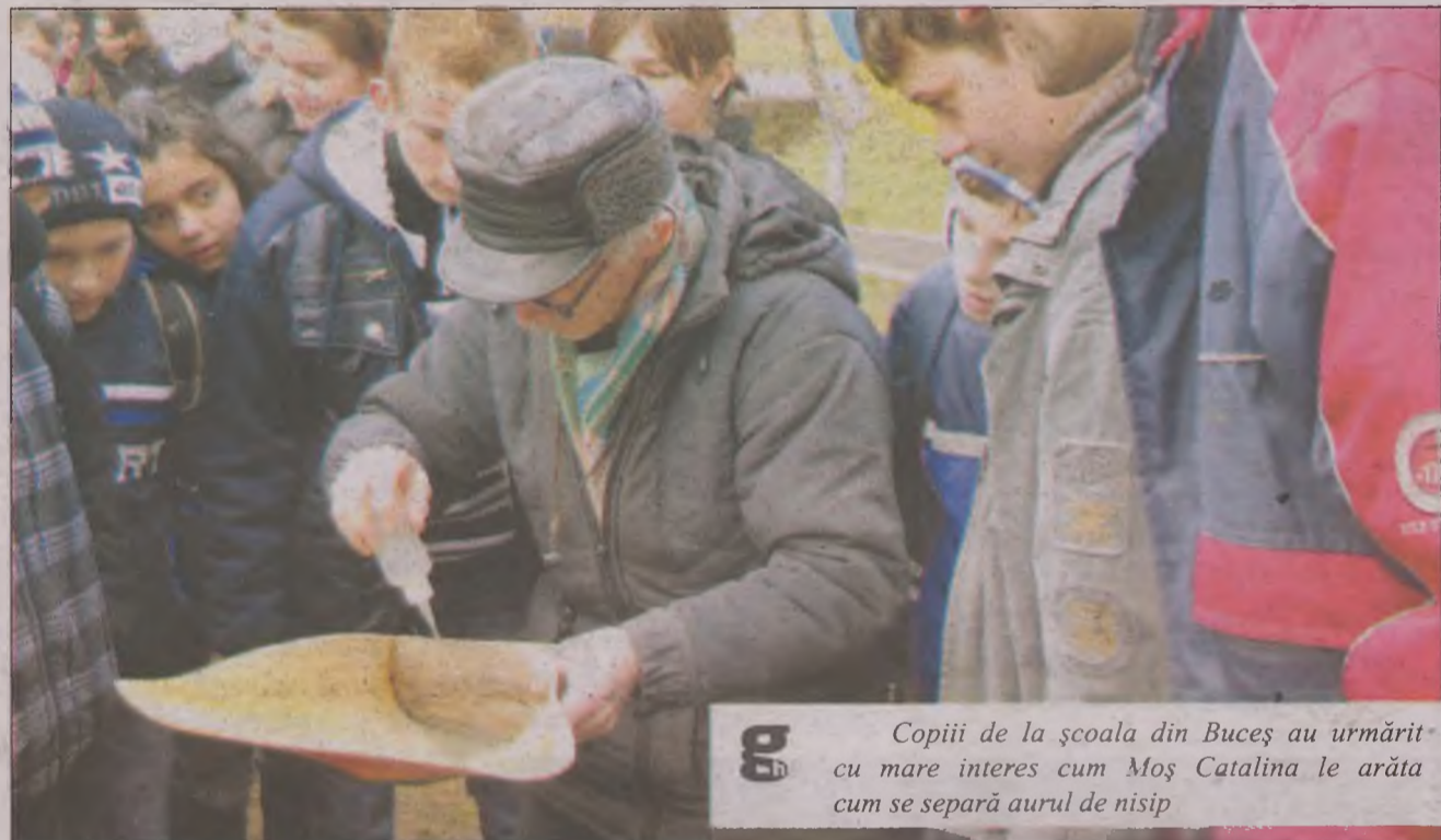
g Copiii de la școala din Buceș au urmărit cu mare interes cum Moș Catalina le arăta cum se separă aurul de nisip

mat. Cei care vor să învețe însă cum se găsește aurul trebuie să fie cât se poate de conștiincioși și să participe la fiecare dintre întâlnirile care avea loc până pe data de 30 martie.