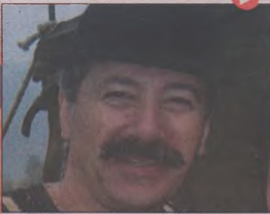
Artiștii, autenticul și viața lor