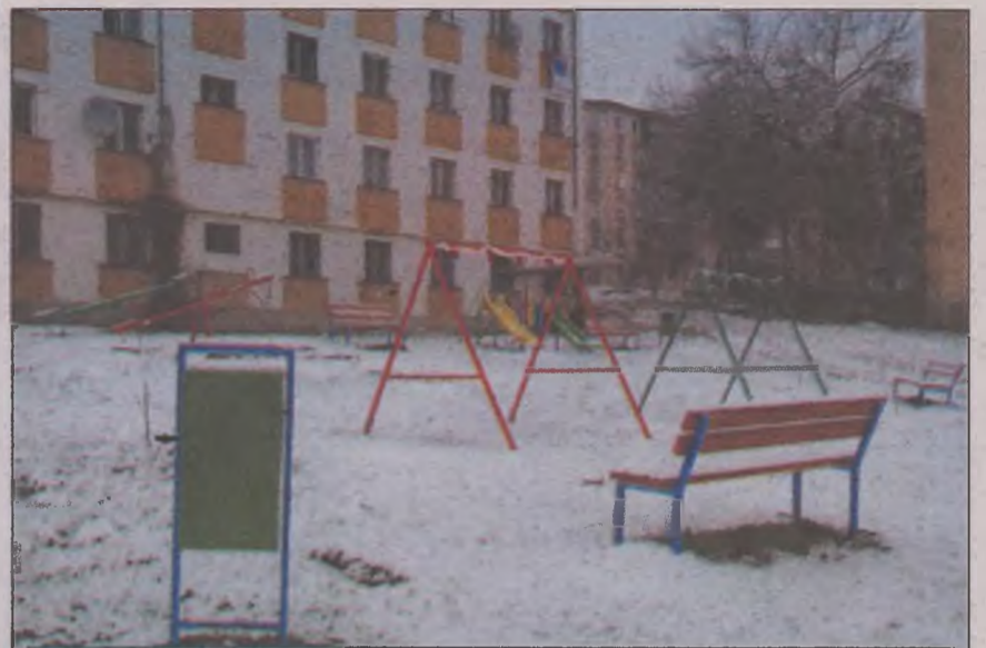
Spațiul de joacă din apropierea blocului social – Micro 7 – spațiu inaugurat în luna noiembrie de Asociația Linișor în colaborare cu Primăria. Ca măsură de protecție a spațiului de joacă, administrația blocului social a depozitat leagănele în subsolul clădirii și asigură supraveghere continuă a zonei.