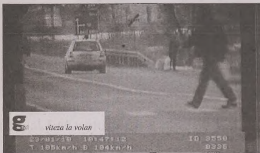
viteza la volan

În numai două zile polițiștii au amendat 159 de șoferi, dintre care 151 au depășit regimul legal de viteză, iar opt dintre sancțiuni au fost aplicate pentru conducere sub influența alcoolului. Totodată pentru 32 de șoferi dreptul de a conduce le-a fost suspendat. Din aceștia, trei au depășit viteza legală cu peste 50 de kilometri la oră, iar opt