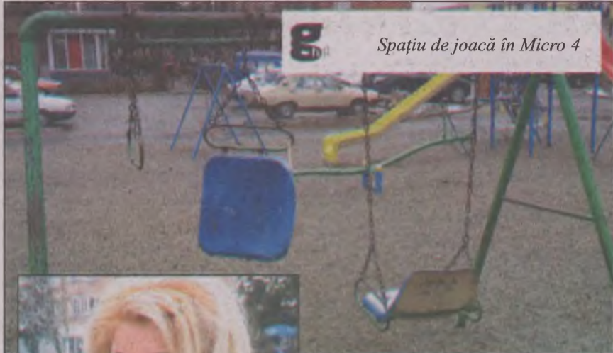
Spațiu de joacă în Micro 4

Toate orașele au cel puțin un spațiu în aer liber, folosibil indiferent de sezon, dedicate celor mici. Cel mai bine sunt întreținute parcurile administrate de diferite asociații sau firme. Nu același lucru se poate spune despre starea actuală a spațiilor de joacă din municipiul Hunedoara care sunt administrate de primărie. Aceste spații de joacă au rămas fără plăcuțe de avertizare, cu leagăne rupte, cu gropi fără nisip care au devenit depozite de gunoi sau closete pentru animalele comunitare, cu băncuțe dezmembrate sau cu topogane înfundate cu crengi și hârtii.