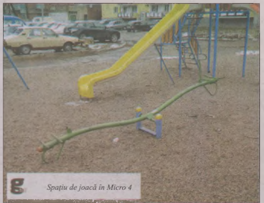
Spațiu de joacă în Micro 4