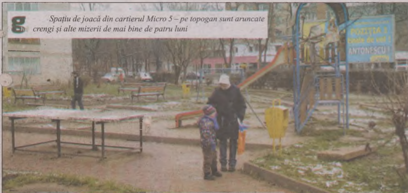
Spațiu de joacă din cartierul Micro 5 – pe topogan sunt aruncate crengi și alte mizerii de mai bine de patru luni