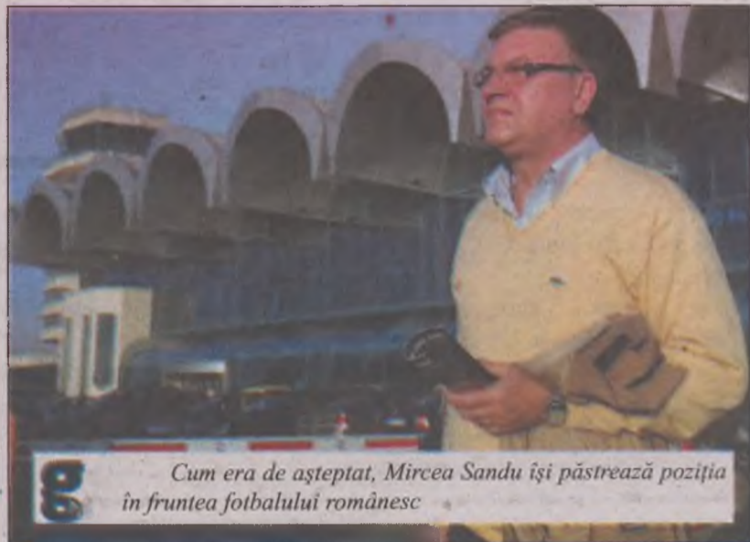
Cum era de așteptat, Mircea Sandu își păstrează poziția în fruntea fotbalului românesc

Mircea Sandu a fost reales în fruntea fotbalului românesc fără niciun fel de emoție. Fostul și actualul președinte al Federației Române de Fotbal a primit mai multe voturi din partea reprezentanților în Adunarea Generală decât în urmă cu patru ani, la precedentele alegeri.