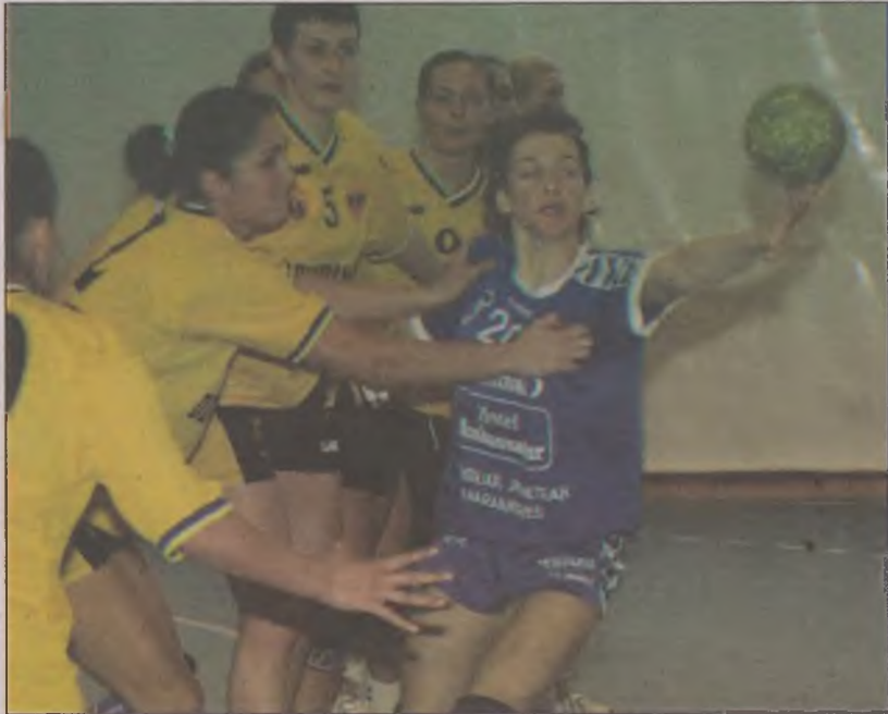
Apărarea deveană nu a mai făcut față în acest meci hăimărencelor

Cetate Deva are o pauză de zece zile până la următorul meci, cel cu Dunărea Brăila. Numirea unui nou antrenor până la meciul din runda cu numărul trei a returului nu se numără însă printre prioritățile conducerii de la Cetate Deva.