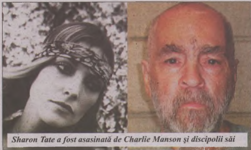
Sharon Tate a fost asasinată de Charlie Manson și discipolii săi

La patru ani de la moartea lui John Lennon, o altă legendă a