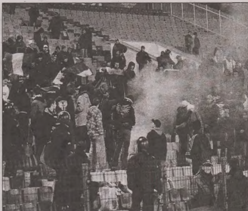
Autoritățile din județul Hunedoara sunt pregătite să ia măsuri dure în cazul manifestărilor violente pe terenurile de sport.