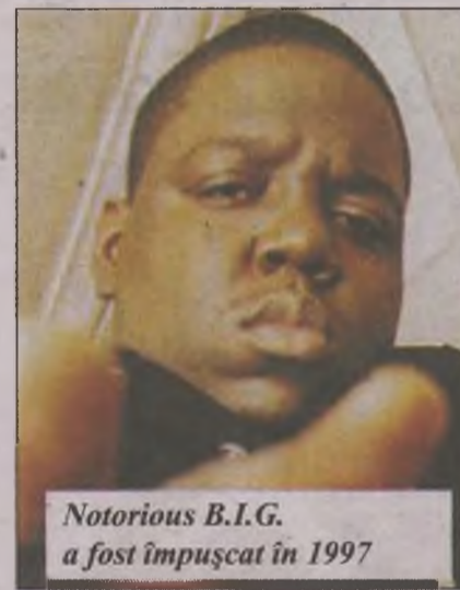
Notorious B.I.G. a fost împușcat în 1997

Vegas pe 13 septembrie 1996. Asasinarea sa, dar și cea a lui Notorious B.I.G., au rămas nerezolvate.