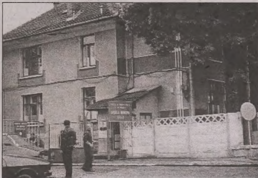
Conducerea spitalului din Brad are de ales între hrana și căldura bolnavilor

Spitalele sunt obligate prin lege să pună la vedere felul în care se aprovizionează cu alimente pentru hrana bolnavilor. Fiecare român are dreptul să știe cum fac piața cei care cumpără cu banii publici, cu cât iau alimentele, de la cine le iau și în ce cantități. În județul Hunedoara doar Spitalul de Urgență Deva joacă cu cărțile pe față. În celelalte unități spitalicești, informațiile sunt aruncate lapidar în pagina de internet a instituției sau nu sunt postate defel.