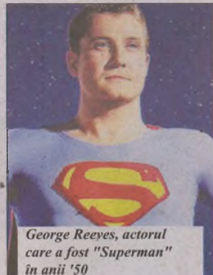
George Reeves, actorul care a fost "Superman" în anii '50

a fost subiectul filmului "Hollywoodland", apărut în 2006, cu Ben Affleck în rolul lui George Reeves.