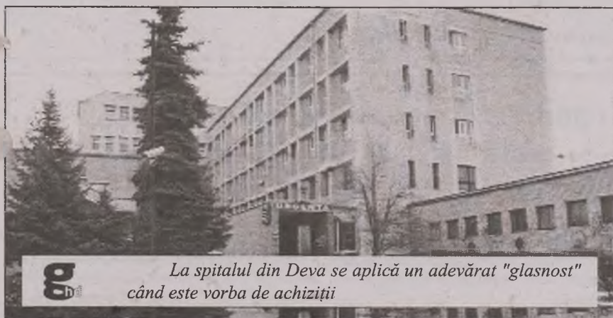
La spitalul din Deva se aplică un adevărat „glasnost” când este vorba de achiziții