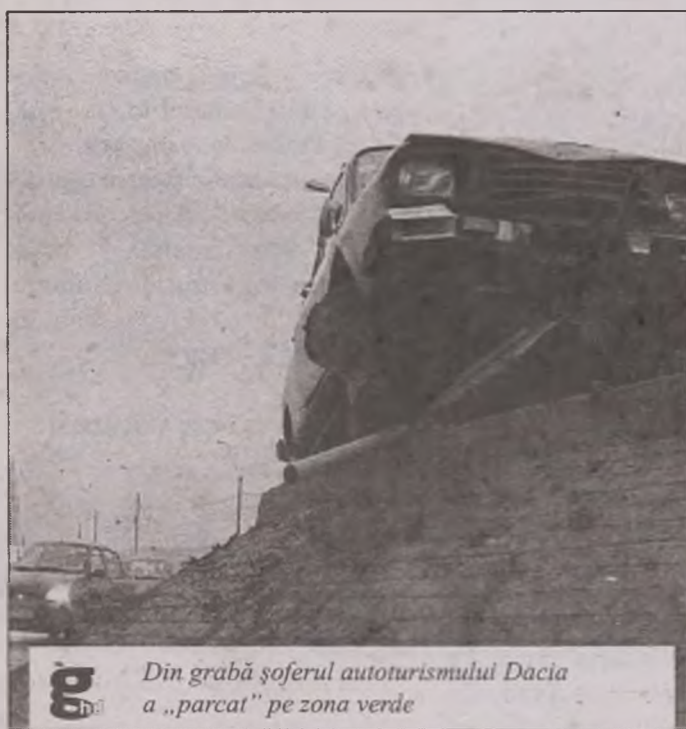
Din grabă șoferul autoturismului Dacia a „parcat” pe zona verde

"Social-democrația se face la talpa țării, nu la București, nu pe Kiseleff. Acolo se îngrășă niște animale, acolo se pervertește social-democrația. Nu vă lăsați de social-democrație și credeți în ea", a subliniat Vasile Pușcaș.