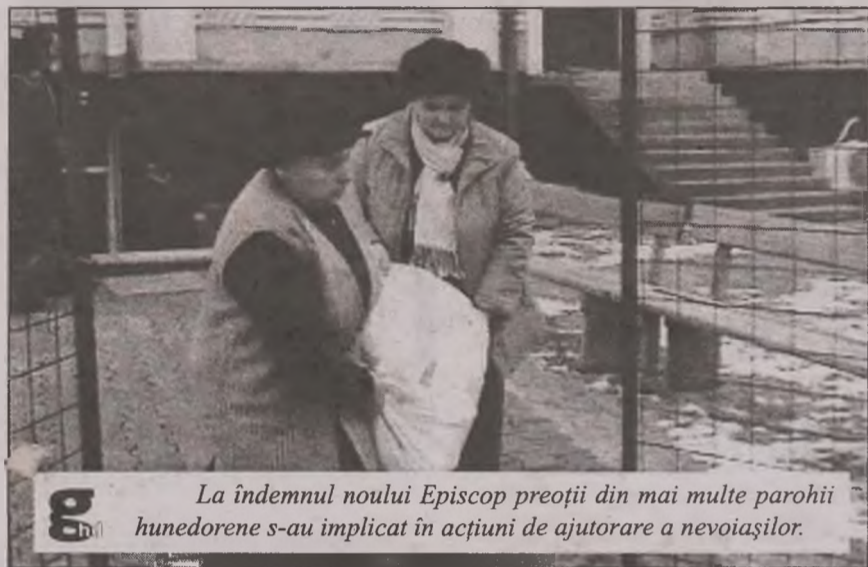
La îndemnul noului Episcop preoții din mai multe parohii hunedorene s-au implicat în acțiuni de ajutorare a nevoiașilor.

„Vrem să mulțumim oamenilor de bine care s-au gândit la noi, la cei care stau în acest cămin neîncetat și vrem să mulțumim Bisericii pentru inițiativă, care a venit în sprințul nostru și n-a uitat că bătrânețea este o parte frumoasă a vieții dacă ne implicăm și noi cei din societate în ea. Încurajez pe semenii noștri de dincolo de aceste porți să ne viziteze”.