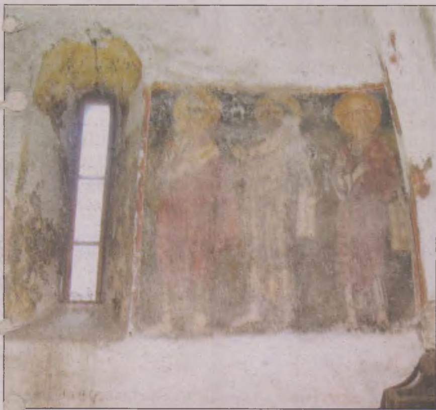
in zig-zag, ornament care se regăsește și la bisericile de la Densuș și Strei.