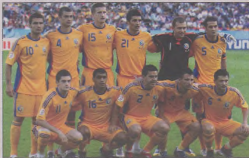
"Generația ratată" mai poate beneficia de o șansă...

Campionatul European de Fotbal din 2012 se va disputa în opt orașe, patru din Polonia și patru din Ucraina, în perioada iunie – iulie. Șase din nouă grupe de calificare vor fi alcătuite din câte șase formații, celelalte trei din câte cinci echipe. La Campionatul European se califică 16 de formații. Câștigătoarelor celor nouă grupe li se adaugă cele două țări organizatoare, cea mai bună clasată de pe locul secund, plus alte patru formații câștigătoare ale meciurilor de baraj.