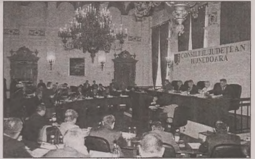
Primarii așteaptă decizia aleșilor județeni