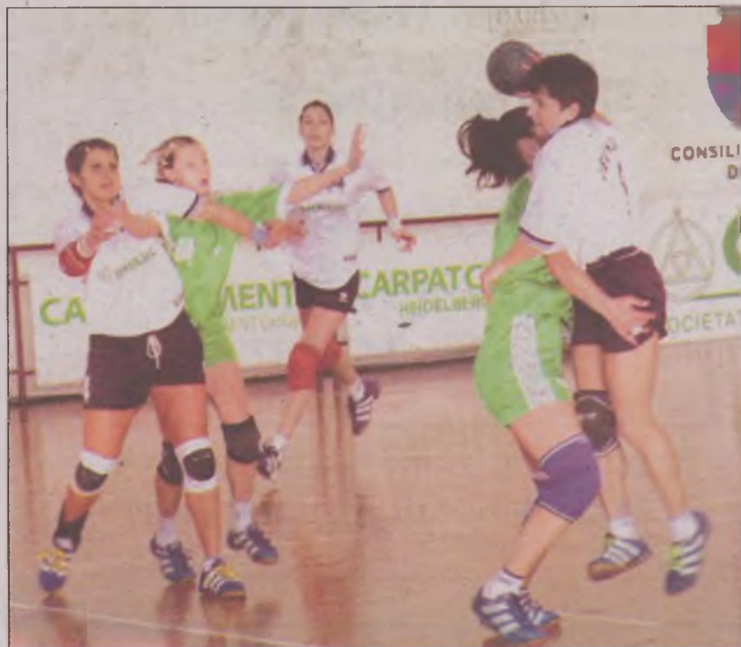
Devenele vor trebui să treacă de apărarea Rulmentului pentru că victoria e obligatorie în acest meci