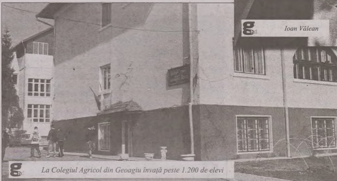
La Colegiul Agricol din Geoagiu învață peste 1.200 de elevi

Școlile de pe raza de administrație a primăriei Geoagiu au fost modernizate și dotate cu încălzire centrală proprie, mobilier nou și calculatoare legate la internet. De asemenea căminele culturale din localitățile apartenente orașului Geoagiu au fost renovate. Drumurile de acces către localitățile Rengheț, Cigmău și Homorod și șapte străzi din stațiunea Geoagiu Băi au fost asfaltate.