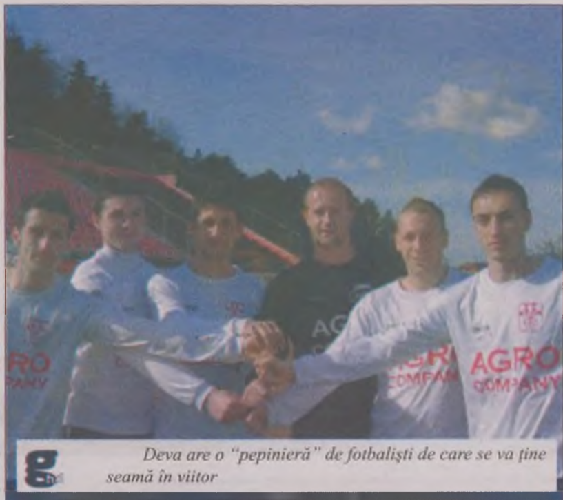
Deva are o "pepinieră" de fotbaliști de care se va ține seamă în viitor