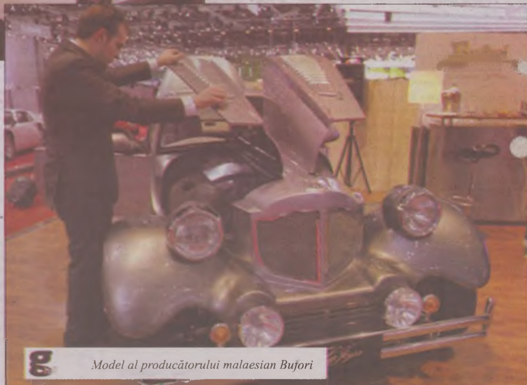
Model al producătorului malaesian Bufori