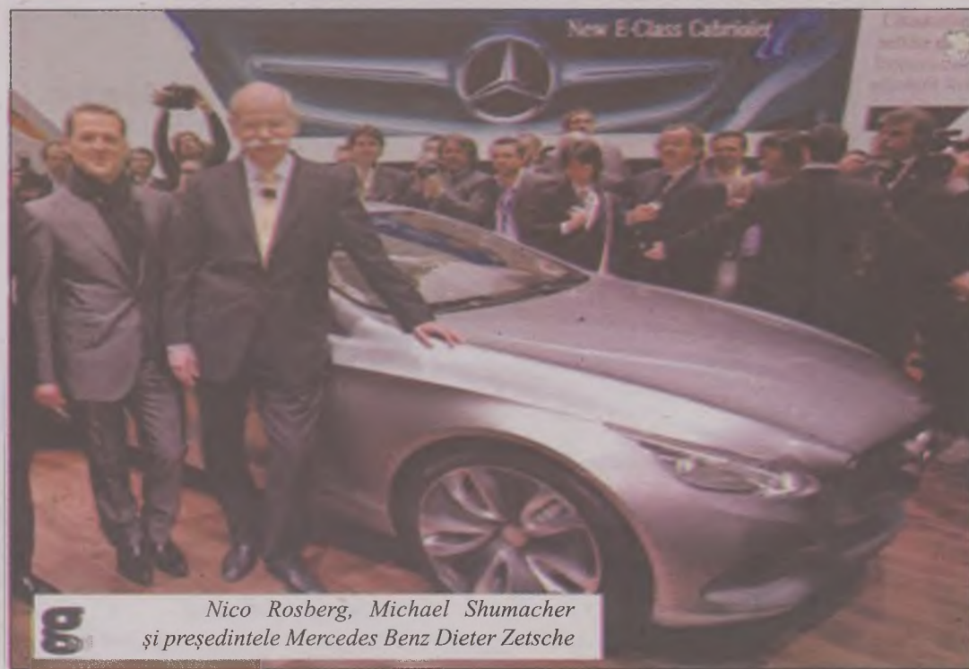
Nico Rosberg, Michael Schumacher și președintele Mercedes Benz Dieter Zetsche