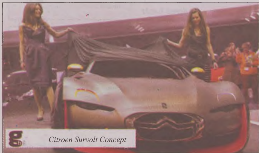
Citroen Survolt Concept