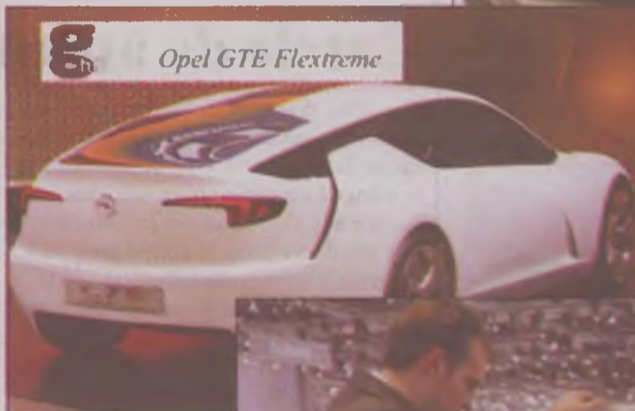
Opel GTE Flextreme