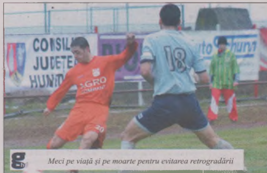
Meci pe viață și pe moarte pentru evitarea retrogradării

Devenii, dar și „minerii” din Lupeni ar putea primi o mână de ajutor de la echipele din serie aflate în situații extreme. FC Baia Mare nu a fost programată în etapa de sâmbătă, pe teren propriu, cu U Cluj. Dacă partida nu se va disputa, răspunsul final urmând a fi dat, azi, de FRF, băimărenii vor fi excluși din competiție pentru două neprogramări. FC Baia Mare nu s-a prezentat în ultima etapă a turului, la FC Drobeta Turnu Severin.