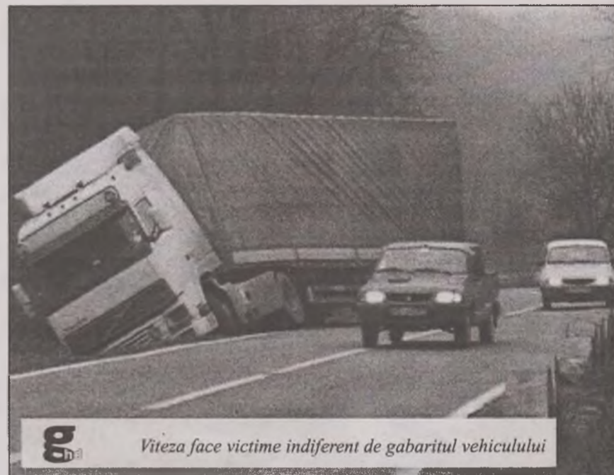
Viteza face victime indiferent de gabaritul vehiculului