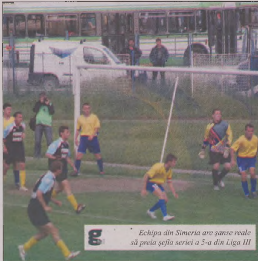
Echipa din Simeria are șanse reale să preia șefia seriei a 5-a din Liga III

În runda cu numărul 20, Minerul Mehedintzi are pauză forțată, iar fostul lider, ACS Receaș, se deplasează la Gloria Arad.