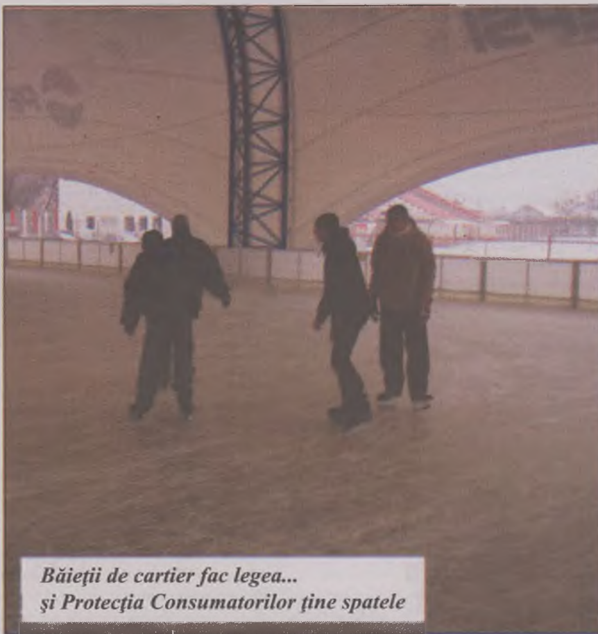
Băieții de cartier fac legea... și Protecția Consumatorilor ține spatele

Povestea reclamației depuse de un deveau la CJPC Hunedoara începe la sfârșitul lunii ianuarie a acestui an. Atunci omul a reclamat faptul că la Patinoarul din Deva nu există personal care să asigure paza și ordinea. Deveauul fusese, într-un sfârșit de săptămână, cu fetița sa în vârstă de 4 ani, la Patinoar. Toată „distracția” a durat mai puțin de jumătate de oră pentru că fetița, traumatizată, a cerut plângând să fie scoasă de pe gheață. Din cauza unor șmecherași de cartier care se distrau pe seama celor lipsiți de apărare, fetița a fost trântită și călcată în picioare de ceata de huligani. Câteva minute mai târziu, tatăl fetei a reclamat incidentul singurului angajat al pati-