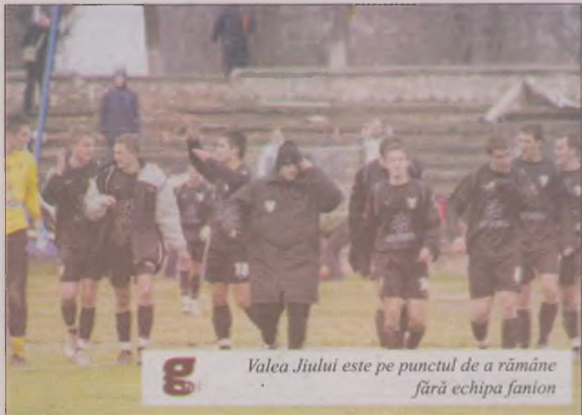
Valea Jiului este pe punctul de a rămâne fără echipa fanion

„Ai reușit să distrugi simbolul Văii Jiului. Ești un criminal!”, spune un suporter în comentariul unui articol apărut pe liga2.ro. Astfel, din cele două meciuri care ar fi trebuit să se joace sâmbătă, se vor disputa doar patru.