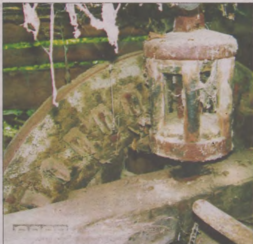
Angrenajul ce mișca pietrele de moară este încremenit de peste 100 de ani