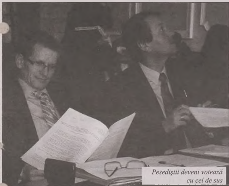
Pesediștii deveni votează cu cel de sus