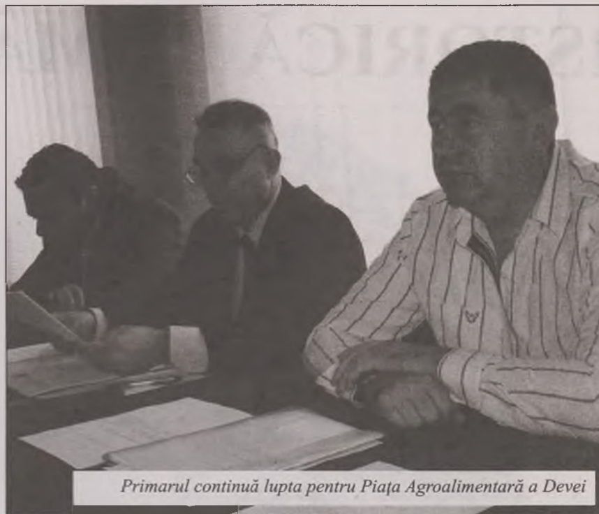
Primarul continuă lupta pentru Piața Agroalimentară a Devei

Proiectul noilor camere video vine la trei ani de la amplasarea altor astfel de aparate în zona Pieței Unirii și pe hotelul din zona Lido. Dacă acea cameră, care a fost amplasată pe hotel, a avut rolul de supraveghere a drumurilor care efectuau lucrările la sensul giratoriu din zonă, celelalte camere au cam închis ochiul vigilent și nu au prea funcționat. Deși scopul lor a fost acela de a-i prinde pe eventualii infractori, camerele au avut un rol pur decorativ. Lucru de altfel recunoscut și de poliștii comunitari care, în urmă cu aproximativ trei săptămâni declarau că: