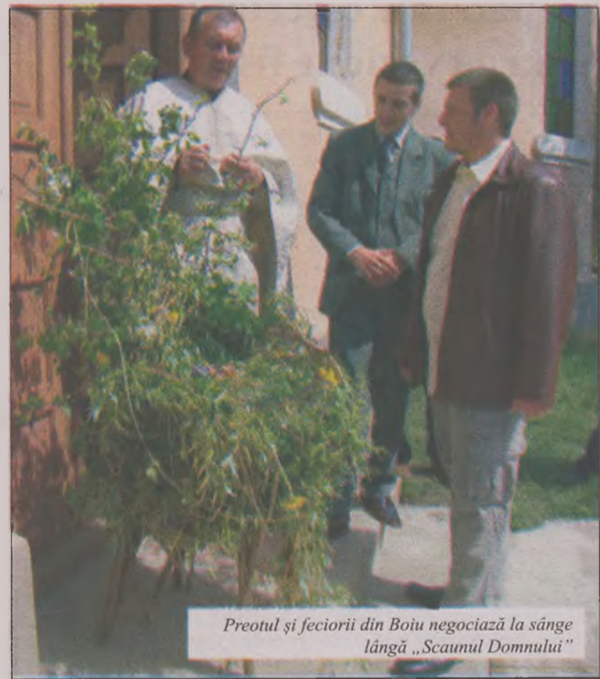
Preotul și feciorii din Boiu negociază la sânge lângă „Scaunul Domnului”