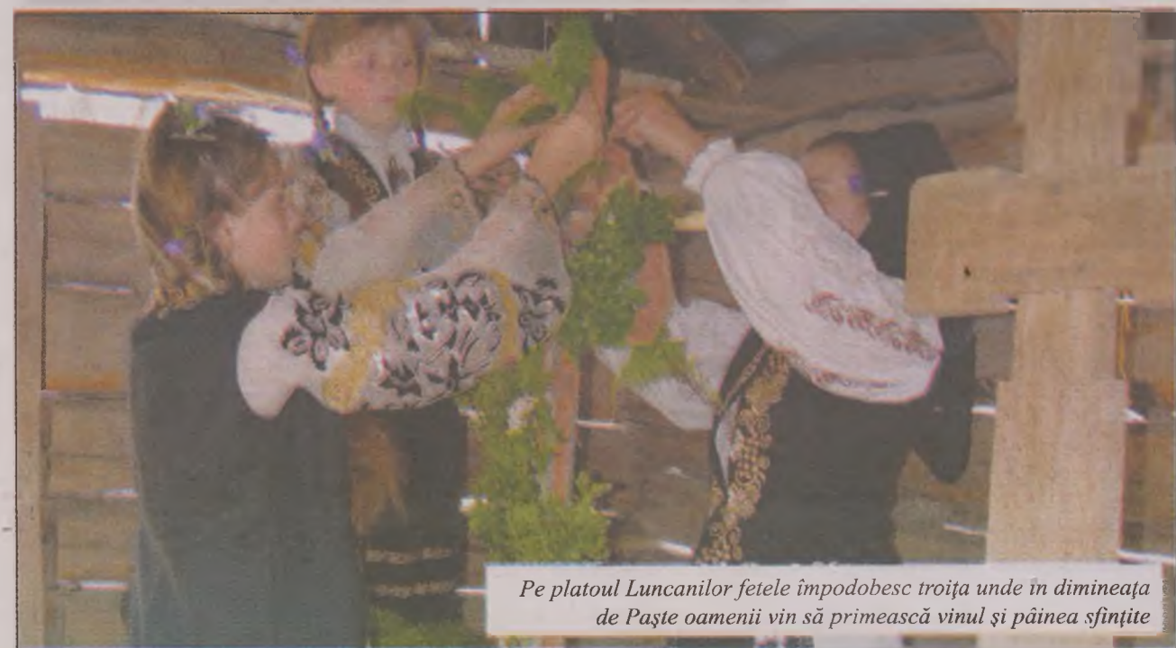
Pe platoul Luncanilor fetele împodobesc troița unde în dimineața de Paște oamenii vin să primească vinul și pâinea sfințite