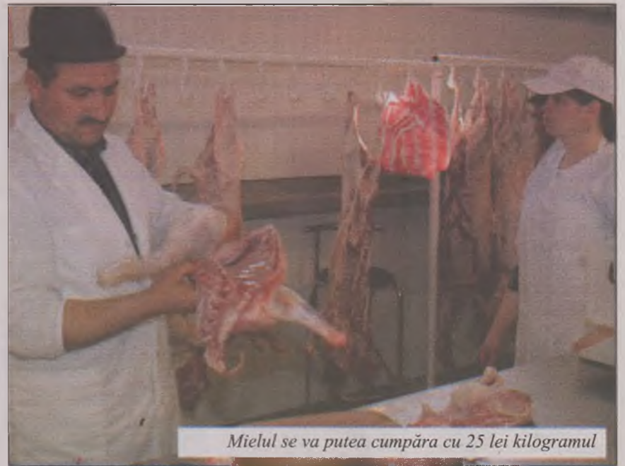
Mielul se va putea cumpăra cu 25 lei kilogramul