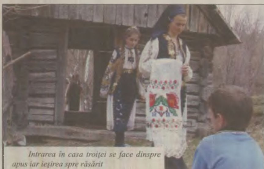
Intrarea în casa troiței face dinspre apus iar ieșirea spre răsărit

meleaguri de mai bine de 200 de ani. Mărturie stă o veche cruce din lemn, putrezită de vreme lângă care de câțiva ani a fost ridicată o nouă troiță. Locuitorii din Cioclovina spun că ritualul denumit „Crucea” le-a fost transmis din timpuri străvechi. Nimeni nu știe cu exactitate cine a născocit acest mod original de a sărbători Paștele. Obiceiul este păstrat cu sfințenie și acum de cele câteva zeci de familii care mai