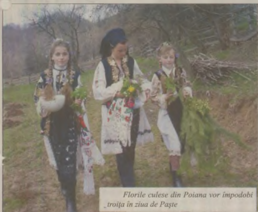
Florile culese din Poiana vor împodobi troița în ziua de Paște