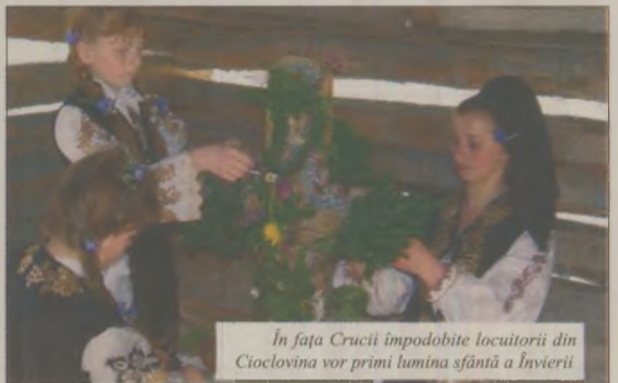
În fața Crucii împodobite locuitorii din Cioclovina vor primi lumina sfântă a Învierii