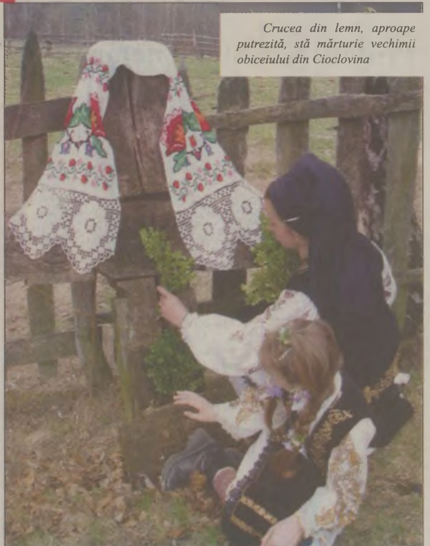
Crucea din lemn, aproape putrezită, stă mărturie vechimii obiceiului din Cioclovina