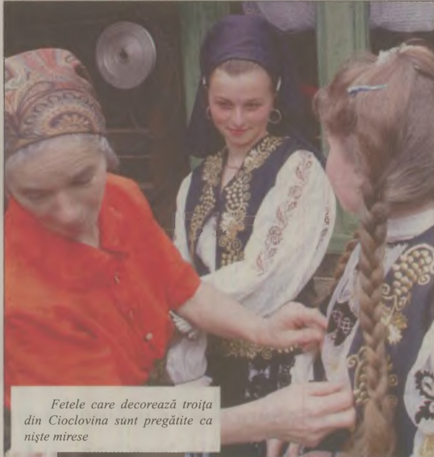
Fetele care decorează troița din Cioclovina sunt pregătite ca niște mirese

În duminica Paștilor toți credincioșii se adună pe Dealul Crucii lângă o troiță și așteaptă cu smerenie ca „pașterii” să le împartă lumina, trupul și sângele mântuitorului. Tradiția dăinuie pe aceste