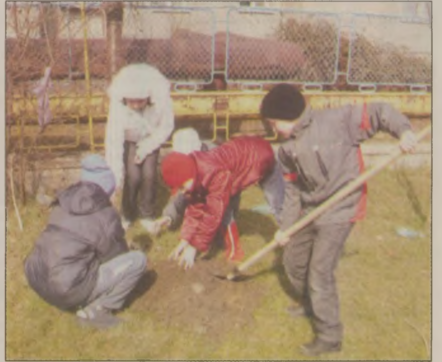
Copii au fost principalele ajutoare ale silvicultorilor la plantat arbori