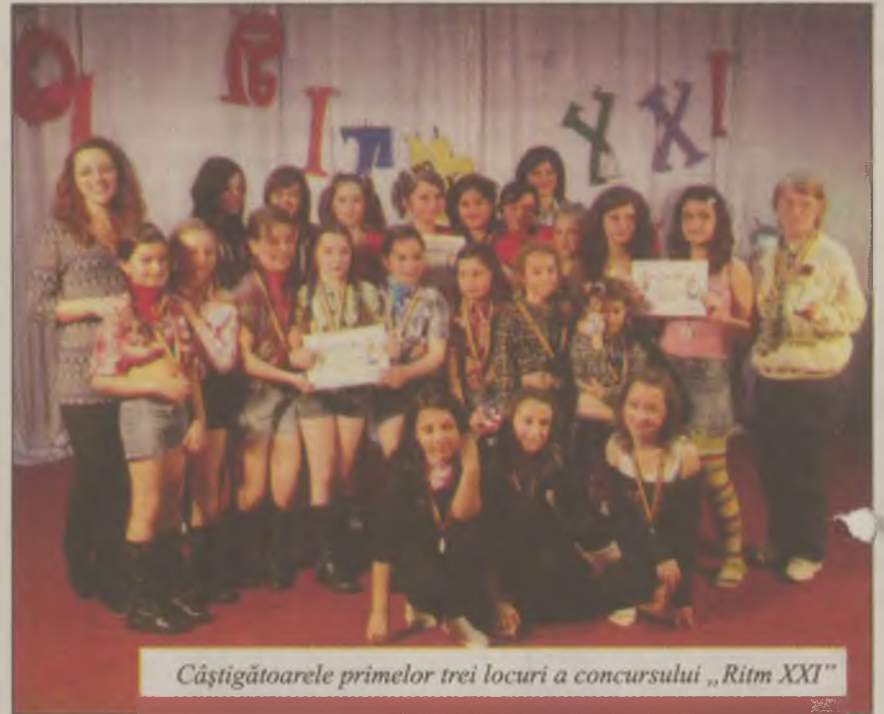
Câștigătoarele primelor trei locuri a concursului „Ritm XXI”