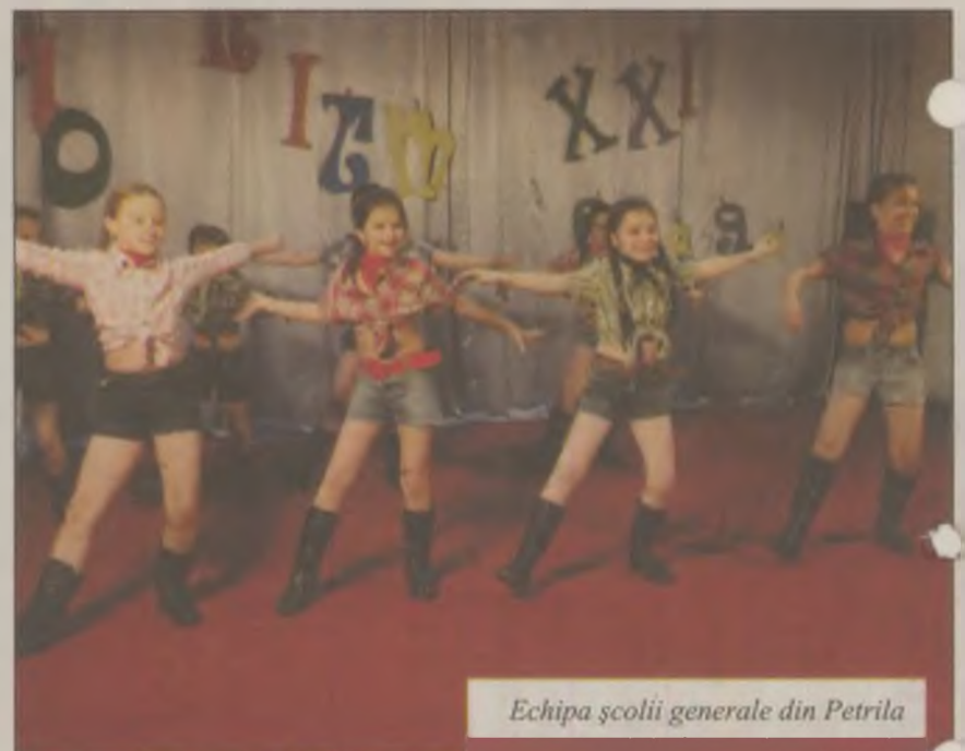
Echipa școlii generale din Petrița