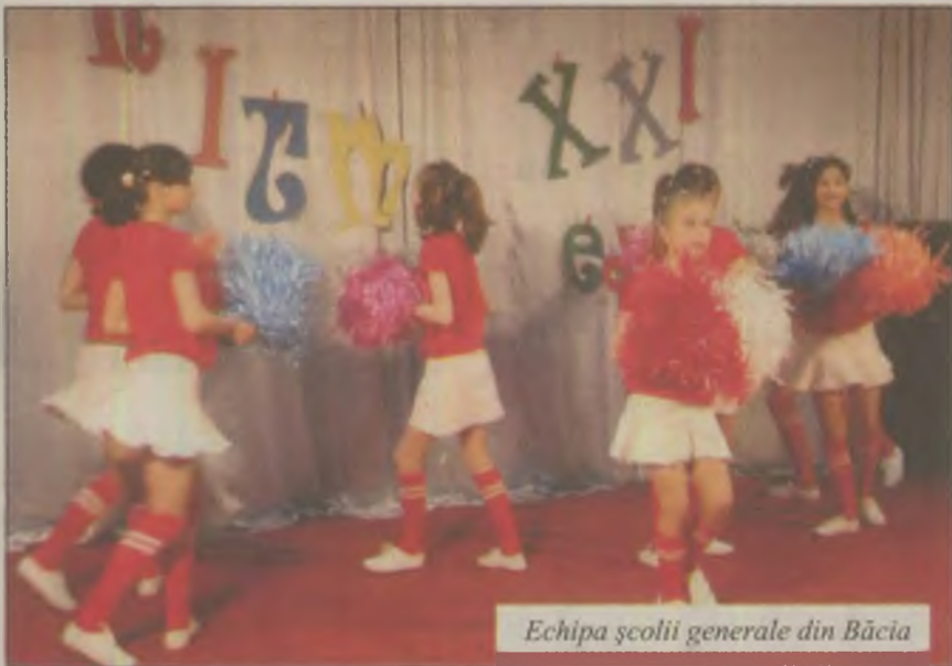
Echipa școlii generale din Băcia

Șase trupe de dansatoare de la școlile din Hunedoara, Băcia și Petrița, au participat la cea de-a noua ediție a concursului de dans modern județean „Ritm XXI”, organizat, vineri, la Clubul Copiilor din municipiu Hunedoara.