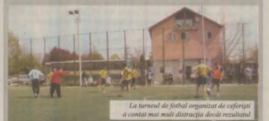
La turneul de fotbal organizat de ceferiști a contat mai mult distracția decât rezultatul