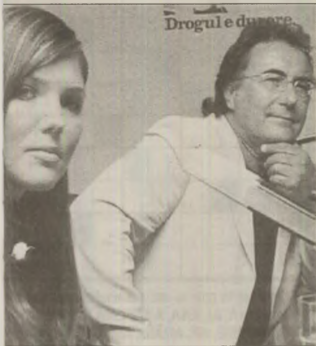
Drogul e durere.

Cântărețul italian Al Bano își declară, într-un mesaj video înregistrat, susținerea pentru Paula Seling în competiția Eurovision, unde cântăreața participă, alături de el, cu melodia "Playing with Fire".