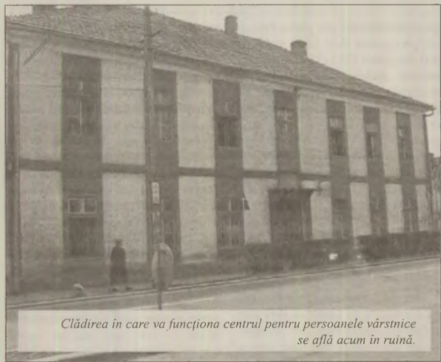
Clădirea în care va funcționa centrul pentru persoanele vârstnice se află acum în ruină.