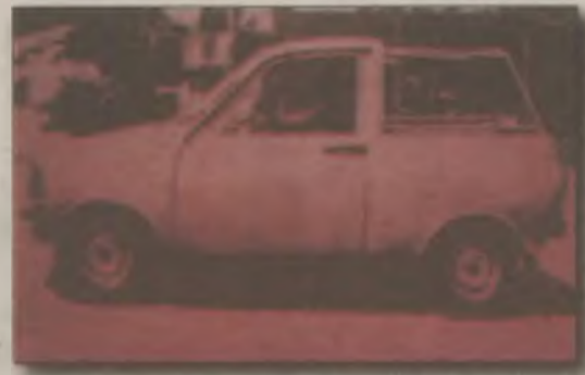
Mini între ce a fost... și ce va fi...

Dacia Mini a fost un prototip, realizat în anul 1980, a unei mașini economice, născută din transformarea modelului Dacia 1310. Putea deveni hatchback, pick-up sau decapotabilă cu efort minim. Conceptul Daciei Mini este reluat de producătorul din Pitești existând deja un prototip care va fi probabil lansat în producția de serie pe parcursul anului 2011.