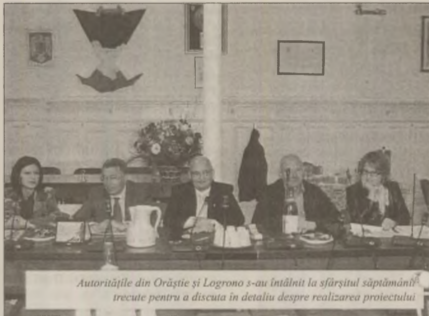
Autoritățile din Orăștie și Logrono s-au întâlnit la sfârșitul săptămânii trecute pentru a discuta în detaliu despre realizarea proiectului

Centrul va avea 30 de locuri pentru servicii rezidențiale permanente. Alte zece locuri vor fi destinate pentru serviciile de zi. Complexul va fi am-