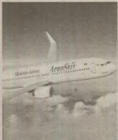
Aeroportul din Chișinău a fost "abuzat" de ucrainenii de la Aerosvit

Un avion ucrainean a intrat ilegal în spațiul aerian al Republicii Moldova și a aterizat fără permisiune pe aeroportul din capitală, motiv pentru care ambasadorul ucrainean a fost convocat vineri la Ministerul moldovean de Externe.