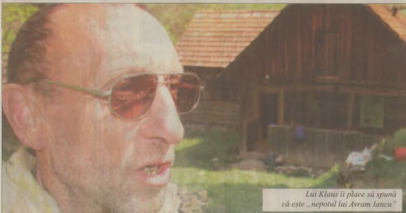
Lui Klaus îi place să spună că este „nepotul lui Avram Iancu”