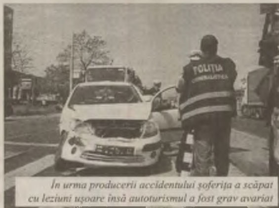
În urma producerii accidentului șoferișia a scăpat cu leziuni ușoare însă autoturismul a fost grav avariat