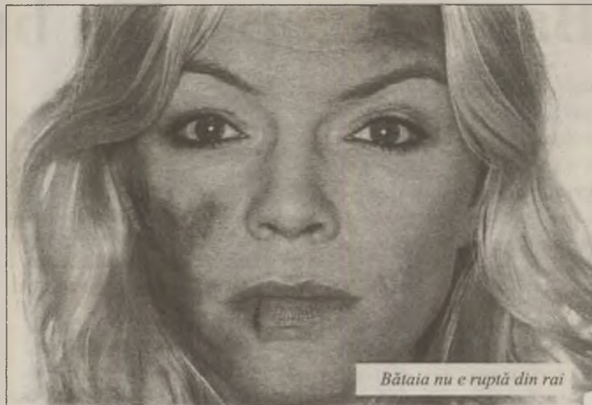
Bătaia nu e ruptă din rai