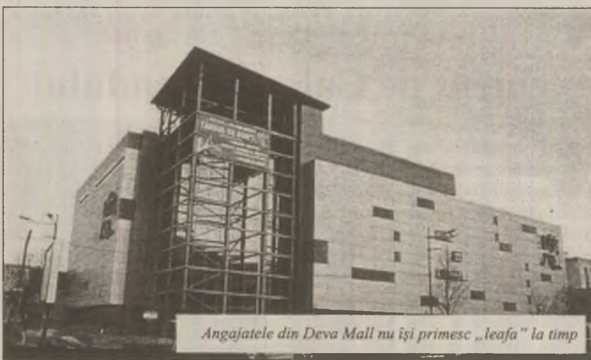
Angajatele din Deva Mall nu își primesc „leafa” la timp

„Cel mai mult am primit 180 lei, în rest ne dădea câte 50 de lei sau mai puțin. Dacă ceream salariul ne răspundea că ni-l dă când vrea ea nu când vrem noi. Spunea mereu că nu