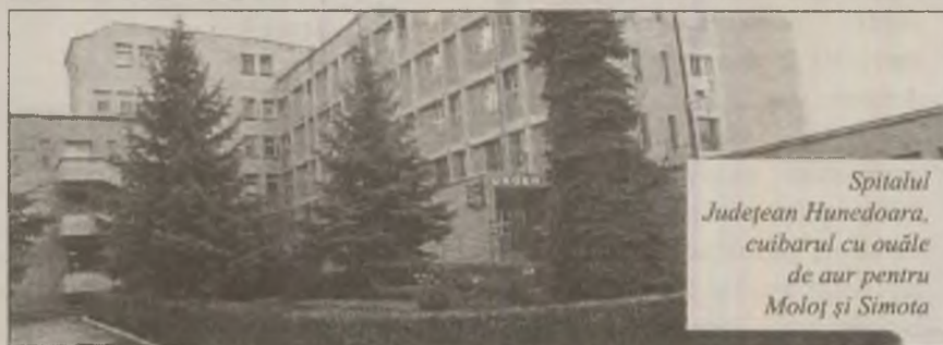
Spitalul Județean Hunedoara, cuibarul cu ouăle de aur pentru Moloș și Simota