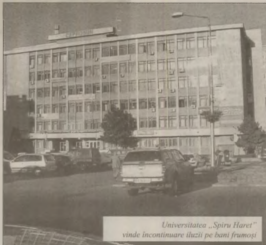
Universitatea „Spiru Haret” vinde în continuare iluzii pe bani frumoși

Absolvenții de la „Spiru Haret”, forma de învățământ la distanță nu știu încă ce au de făcut. Ei consideră că toată încurcătura rezultă dintr-o interpretare diferită a legii. „Am absolvit forma de învățământ la distanță care nu era acreditată, dar specializarea la zi avea acreditare. Legislația prevede că diplomele pentru aceeași specializare sunt echivalente, indiferent de forma de învățământ absolvită. Absolvenților ar trebui să li se spună cum pot să-și echivaleze studiile, pentru că eu nu am găsit nici o facultate care să-mi