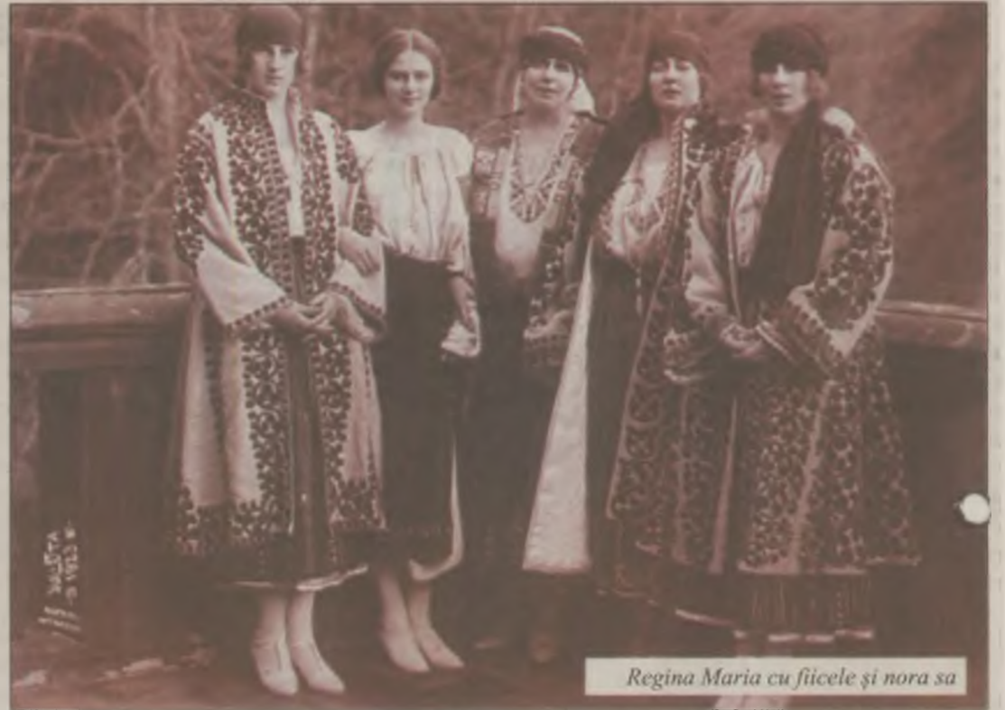
Regina Maria cu fiucele și nora sa

Regele Ferdinand I al României, principe de Hohenzollern (24 august 1865, Sigmaringen – 20 iulie 1927, Sinaia). A fost încoronat rege al României la data de 10 octombrie 1914. În ianuarie 1893 s-a căsătorit cu Maria de Edinburgh, nepoata Reginei Victoria a Angliei. Din 1890 a fost primit ca membru de onoare al Academiei Române. În timpul său România a devenit „mare și dodoloață” în urma actului Unirii de la 1 Decembrie 1918, iar regelui i s-a spus „Întregitorul”.