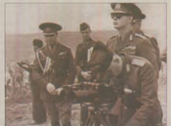
Regele Mihai I cu mareșalul Antonescu în vizită pe front