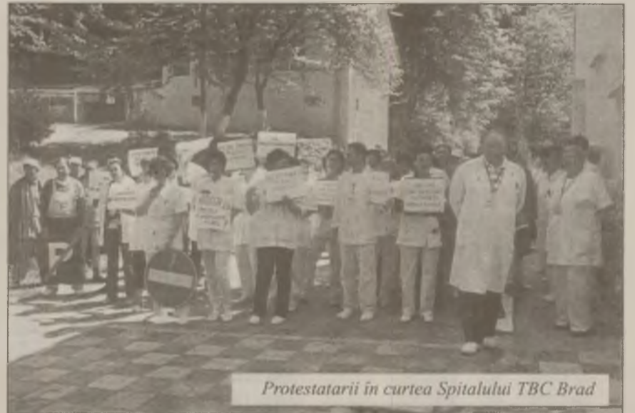
Protestatarii în curtea Spitalului TBC Brad