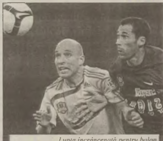
Lupta încrâncenată pentru balon a caracterizat finala Cupei României de la Iași

FR Cluj a câștigat finala Cupei României împotriva echipei FC Vaslui după un meci decis la loviturile de departajare cu scorul de (5-4). După timpul regulamentar de 120 de minute scorul a fost egal, 0 - 0.