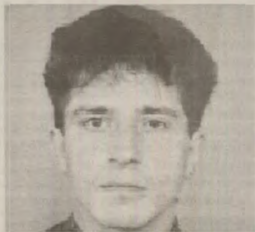
pe obrazul stâng.

Ca semn particular, bărbatul are o aluniță