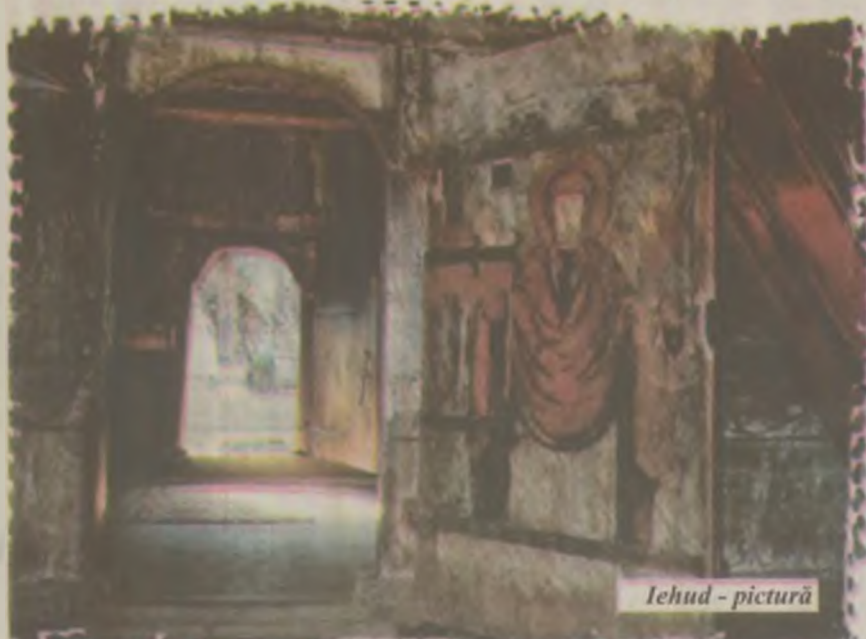
Ieud - pictură