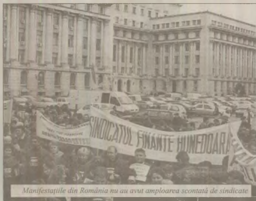
Manifestațiile din România nu au avut amploarea scontată de sindicate