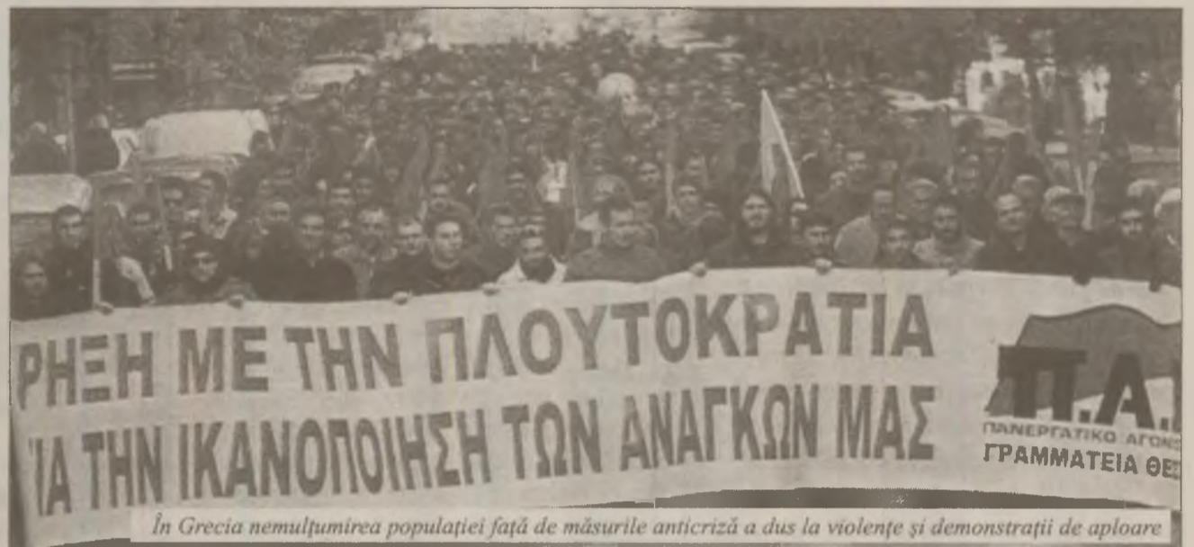
În Grecia nemulțumirea populației față de măsurile anticriză a dus la violențe și demonstrații de aploare

Guvernul socialist portughez condus de Jose Socrates își propune să