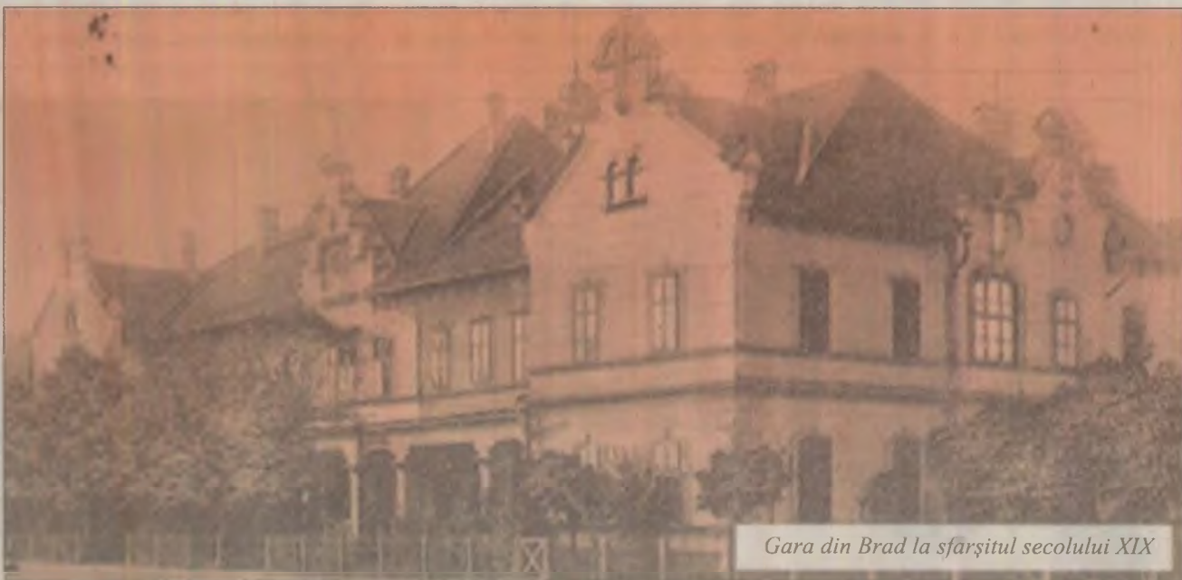
Gara din Brad la sfârșitul secolului XIX

Municipiul Brad reprezintă stația finală a liniei de cale ferată Sântana – Brad, dată în folosință în anul 1896. Construcția căii ferate a fost realizată de către Societatea Feroviară „Arad – Cenad” în mai multe etape: tronsonul Arad-Seleuș s-a dat în folosință în anul 1876, traseul Seleuș - Ineu în anul 1877, tronsonul Ineu - Sebiș în anul 1881, tronsonul Sebiș-Romanița în anul 1889, iar cel Romanița - Ocișor în anul 1893. Tunelul de la Vârfuri s-a terminat în anul 1892. Tronsonul Ocișor-Brad a fost finalizat în anul 1896, primul tren intrând în gara Brad la 6 decembrie 1896. Calea ferată a funcționat în administrarea Societății Feroviare „Arad – Cenad” până în anul 1925, când a fost trecută în proprietatea statului român, Ministerul Comunicațiilor fiind autorizat să ia în exploatare toate căile ferate particulare de pe teritoriile alipite după Marea Unire. Alături de alte active ale „capitalului inamic”, calea ferată particulară Arad – Brad a fost preluată cu întregul ei patrimoniu în valoare de 56.791 acțiuni, în contul despăgubirilor de război pe care le-a primit România de la statele învinse în Primul Război Mondial.