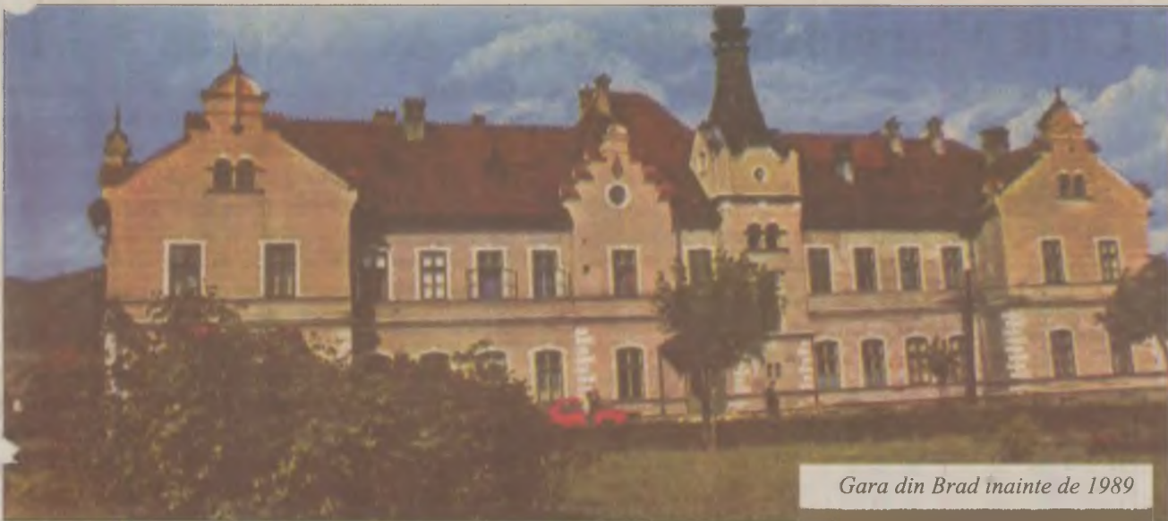
Gara din Brad înainte de 1989