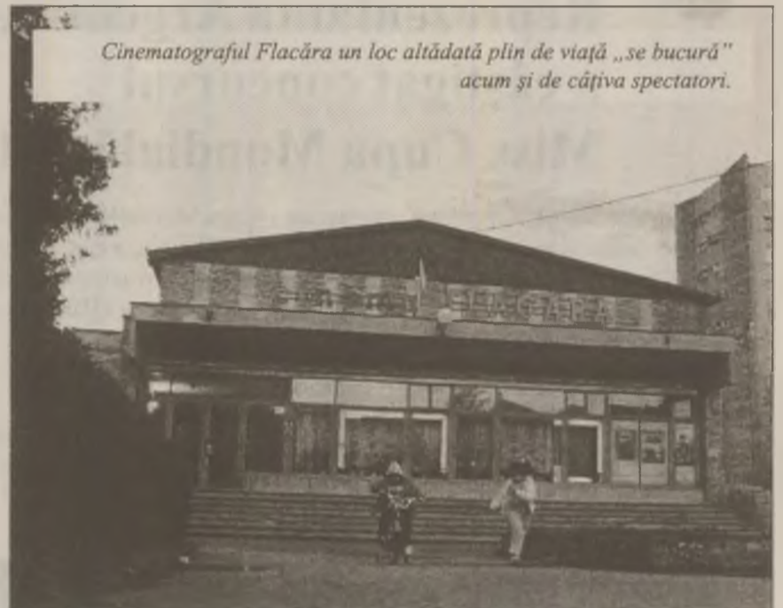
Cinematograful Flacăra un loc altădată plin de viață „se bucură” acum și de câțiva spectatori.

Dacă înainte cinematograful se dovedea neîncăpător pentru mulțimile de spectatori, acum Traian Ilincari dă drumul la film și pentru 2 oameni. „Nu e profitabil, dar e vorba de respectul față de spectator. Omul a bătut drumul până la cinema, știind și care sunt condițiile. Cum să îl întorc din drum?” spune administratorul. El a observat că declinul cinematografului a început imediat după '90. Primul „inamic” al peliculei a fost