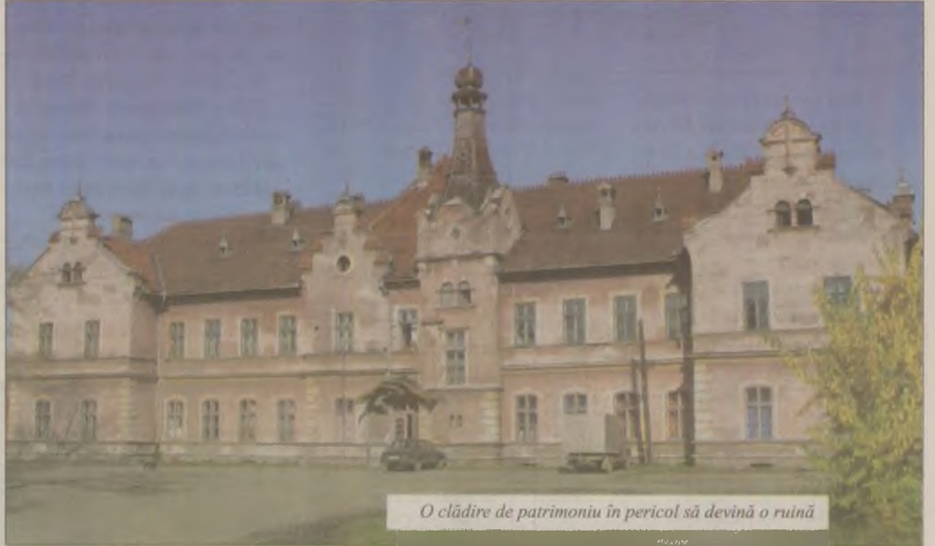
O clădire de patrimoniu în pericol să devină o ruină

domină construcția. În timpul lucrărilor de construcție a fost descoperit întâmplător un depozit de piese din bronz cuprinzând un topor, un vârf de lance și două brățări, aparținând primei vârste a fierului. Gara a devenit repede unul dintre punctele de reper ale Bradului, unul dintre simbolurile zonei, fiind pentru o vreme cea mai masivă construcție din zonă, până ce i s-au alăturat clădirea Liceului „Avram Iancu” și cea a cazarmei care a adăpostit batalionul vânătorilor de munte. Localnicii în vârstă își aduc aminte că în anii '30 - '40 șeful gării a fost Nicolae Beligan, tatăl cunoscutului actor Radu Beligan. Cândva una dintre cele mai frumoase și impunătoare clădiri de pe valea Crișului Alb, gara din Brad este astăzi aproape o ruină. Deși a fost declarată clădire de patrimoniu, fiind cuprinsă în Lista Monumentelor Istorice din România, construcția de pe strada Avram Iancu, numărul 52 din Brad nu a făcut niciodată, în cei 114 ani de existență, obiectul unor lucrări de consolidare și renovare. Curgerea vremii și multiplele intervenții pentru adaptarea și funcționalizarea edificiului la cerințele epocii i-au șubrezit structura de rezistență. Astăzi, sub elementele arhi-