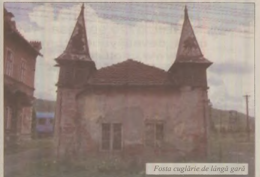
Fosta cuglărie de lângă gară

„(...)Și-atunci a făcut o școală și a intrat la Căile Ferate Române. Dar târziu de tot mi-am dat seama ce e în sufletul lui. Era impiecat-șef la Brad – Brad e o stație finală – și a făcut acolo o grădină frumoasă în față și stătea pe un șezlong și se uita de-a lungul liniilor (...).” Amintirile actorului Radu Beligan despre tatăl său, fost șef de gară la Brad.