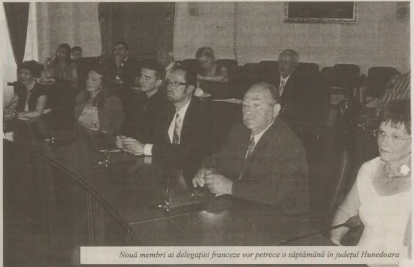
Nouă membri ai delegației franceze vor petrece o săptămână în județul Hunedoara

„Am format o echipă care să reprezinte Consiliul Județean și am purtat discuții cu primarii din comunele județului. E drept că, la început, au manifestat o oarecare reticență în ceea