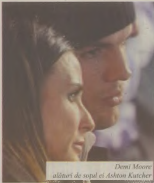
Demi Moore alături de soțul ei Ashton Kutcher

Demi Moore își va lansa memoriile în 2012, într-un volum în care va relata detalii despre cele trei mariaje ale sale și despre cele trei decenii de carieră la Hollywood, actrița americană primind peste 2 milioane de dolari pentru drepturile de publicare a cărții.