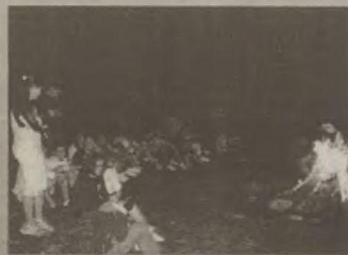
Participanții și organizatorii „Noptilor Antidrog” au cântat și s-au distrat în jurul focului, până târziu în noapte

Tinerii hunedoreni știu să se distreze și fără să consume tutun sau alcool. Un grup de 30 de liceeni din municipiul Hunedoara au participat la cea de-a parta ediție a concursului „Nopti Antidrog”, desfășurată în munții Retezat, sub organizarea Asociației Antidrog „Alege Viața”.