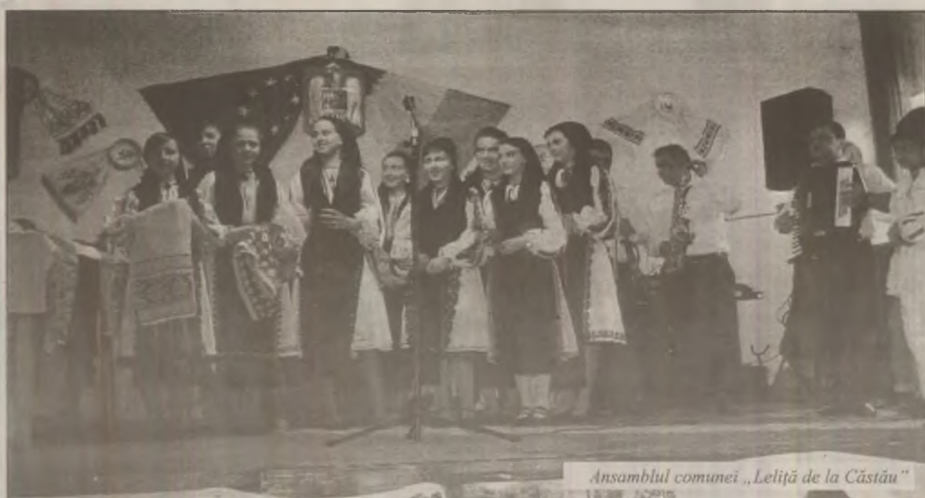
Ansamblul comunei „Leliță de la Căstău”