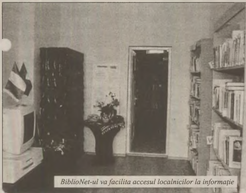
BiblioNet-ul va facilita accesul localnicilor la informație