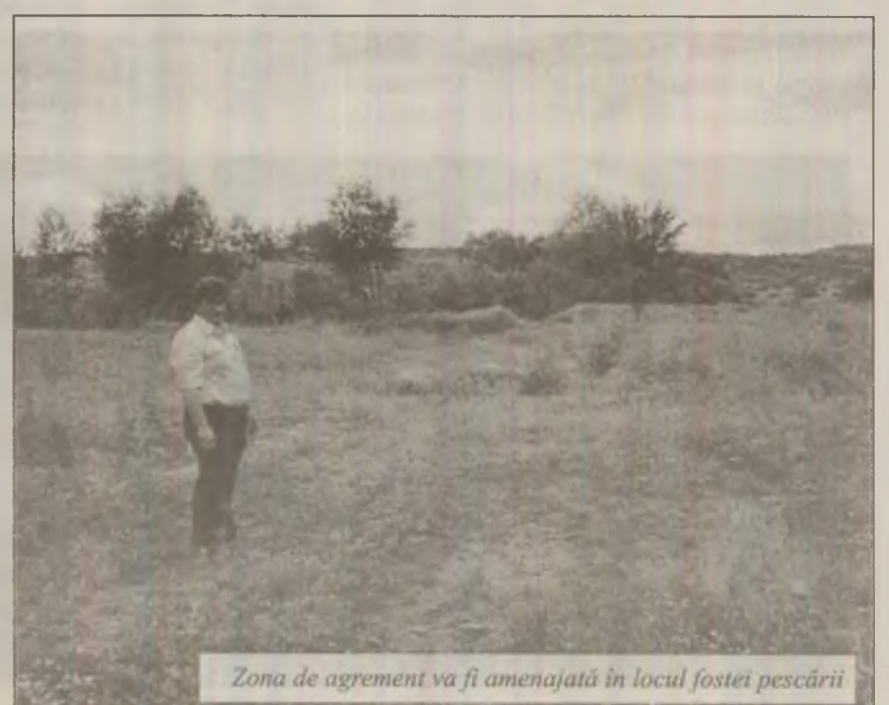
Zona de agrement va fi amenajată în locul fostei pescării