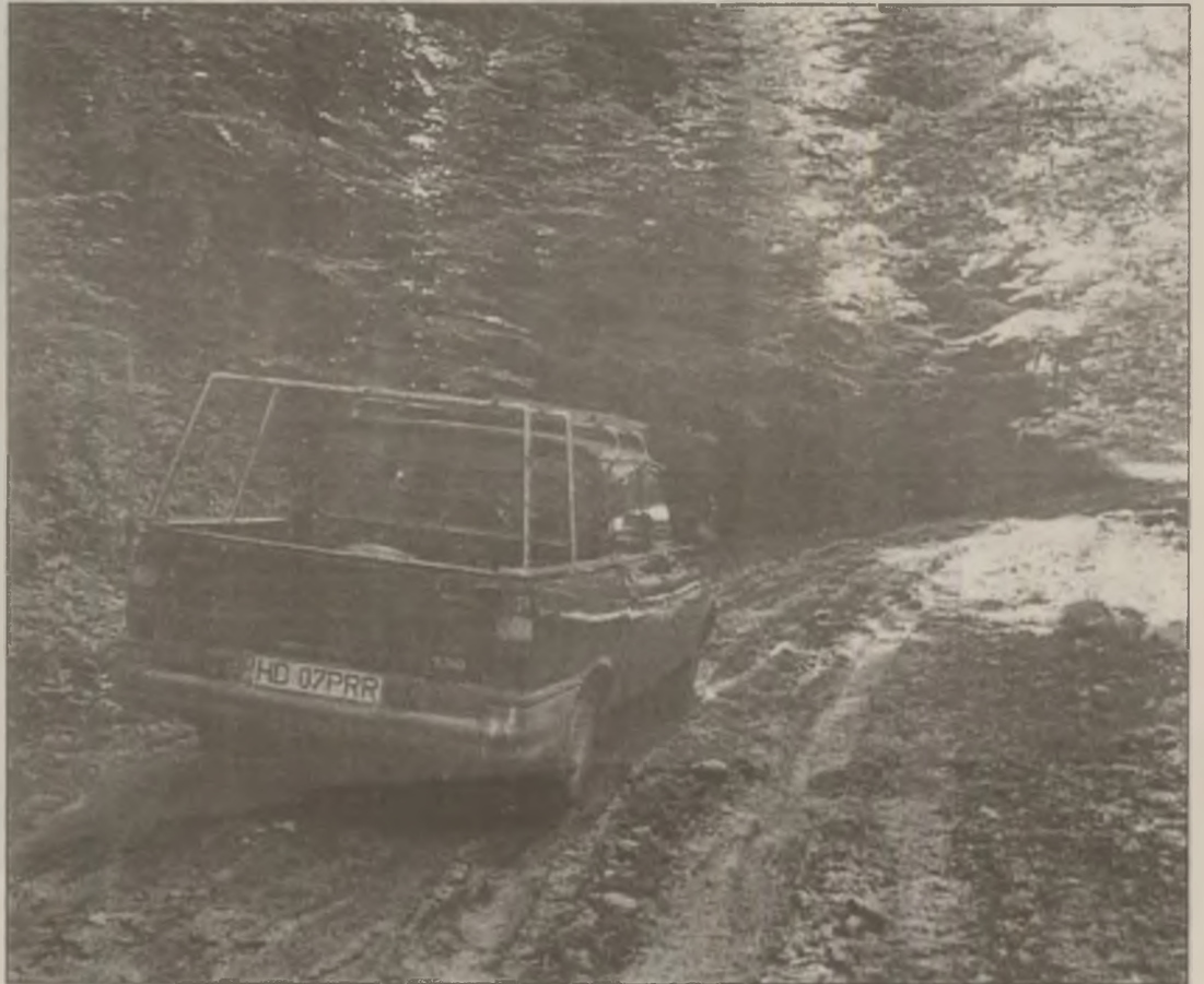
Drumul spre Cheile Ribicioarei este impracticabil din cauza mașinilor de transport buștean.