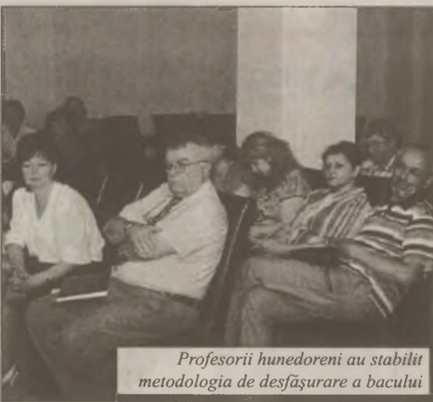
Profesorii hunedoreni au stabilit metodologia de desfășurare a bacului

De asemenea, conducerea liceelor trebuie să informeze cadrele didactice, elevii și părinții despre interdicția de a colecta fonduri materiale sau bănești în scopul asigurării cazării, mesei și a altor beneficii pentru membrii comisiilor de bacalaureat. ISJ Hunedoara va organiza în data de 26 iunie o ședință publică în cadrul căreia se va efectua tragerea la sorți a membrilor comisiilor de bacalaureat.