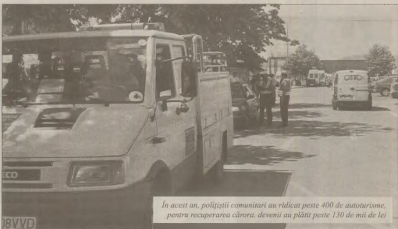
În acest an, polițiștii comunitari au ridicat peste 400 de autoturisme, pentru recuperarea cărora, devenii au plătit peste 130 de mii de lei

Odată coborât brațul platformei noi avem datoria de a transporta mașina în parcul auto”, a declarat Vasile Bulea, agent comunitar superior.