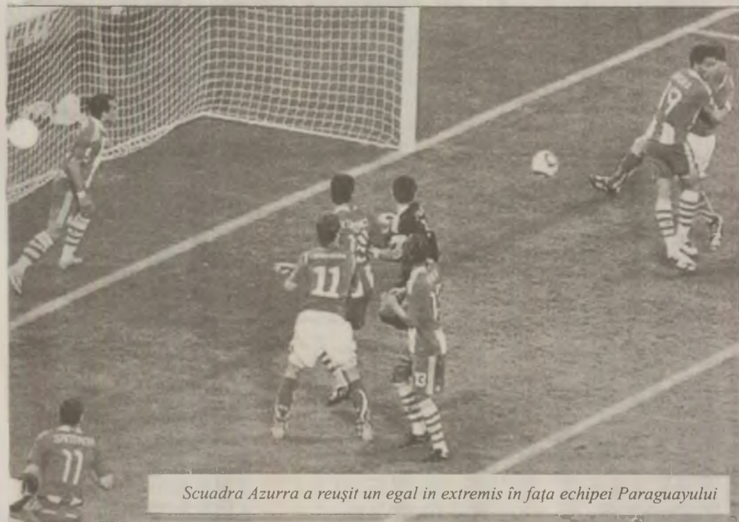
Scuadra Azzurra a reușit un egal în extremis în fața echipei Paraguayului