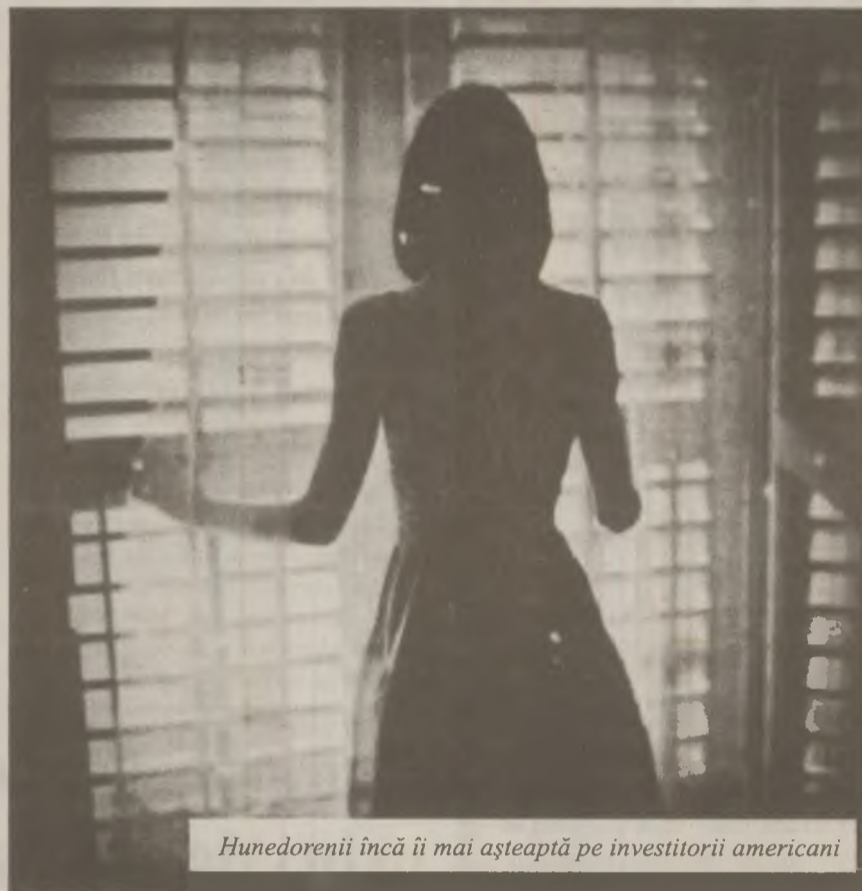
Hunedoreniii încă îi mai așteaptă pe investitorii americani