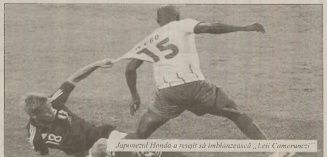
Japonezul Honda a reușit să imblânzească „Leii Camerunezi”