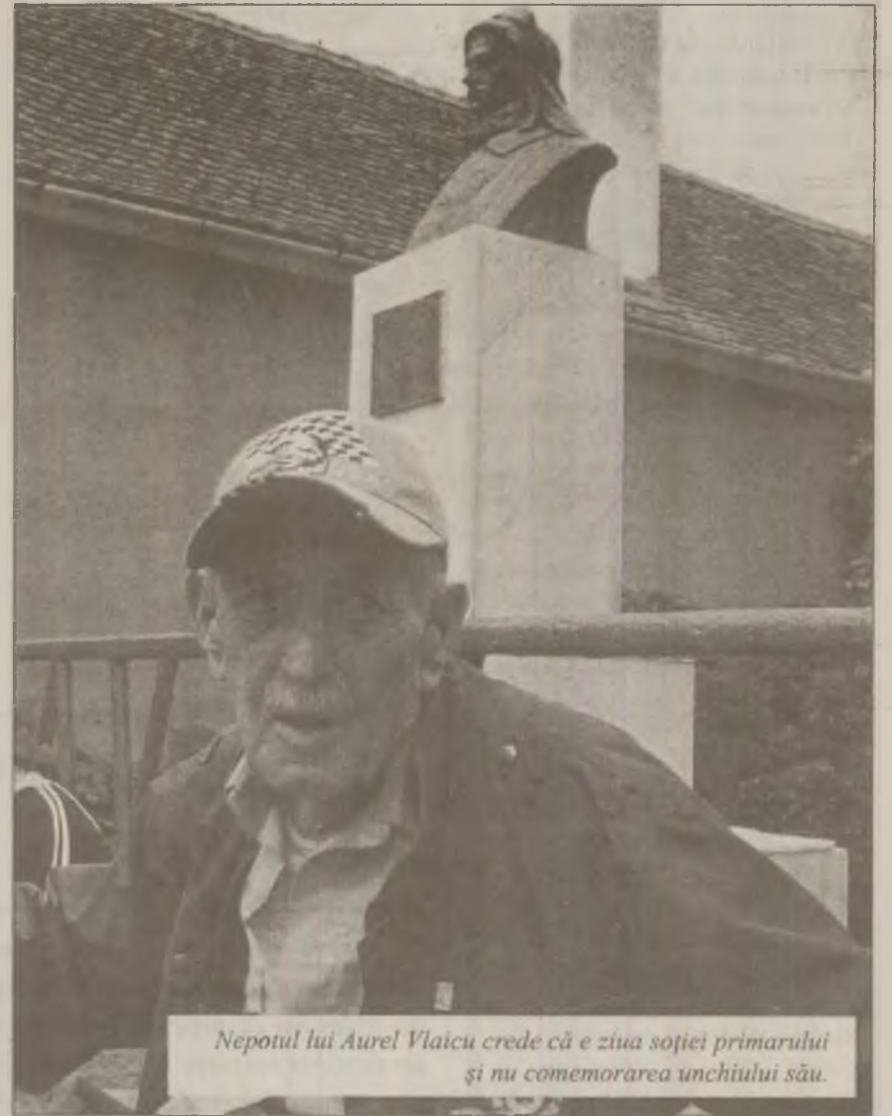
Nepotul lui Aurel Vlaicu crede că e ziua soției primarului și nu comemorarea unchiului său.