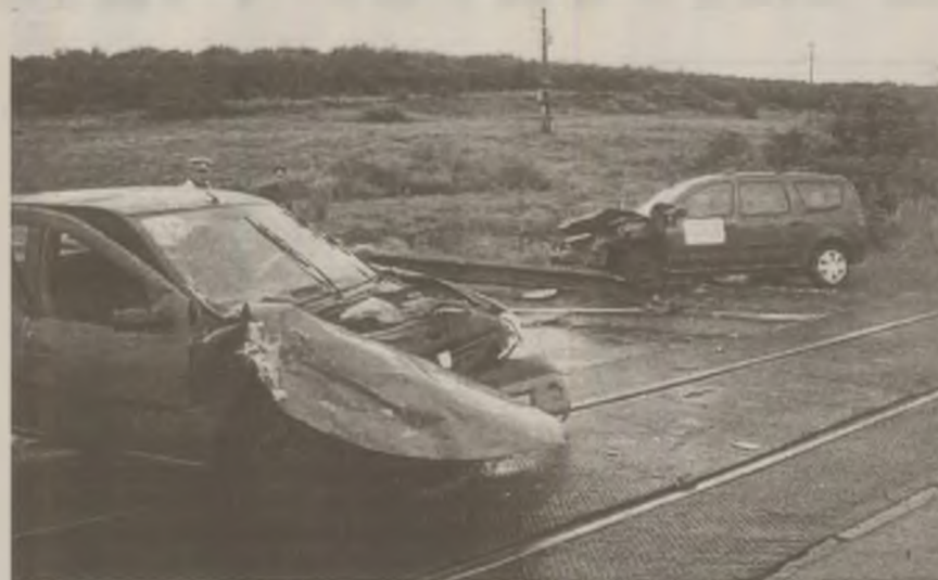
Circulația rutieră pe Drumul spre Deva spre Simeria, prin localitatea Național 7 a fost întreruptă mai bine de două ore, iar traficul a fost deviat, din Săulești.

Pentru salvarea tuturor răniților a fost nevoie de mobilizarea a șapte ambulanțe SMURD și de un echipaj de descarcerare, care a scos dintr-un autoturism două persoane care au fost prinse între fiarele mașinii.