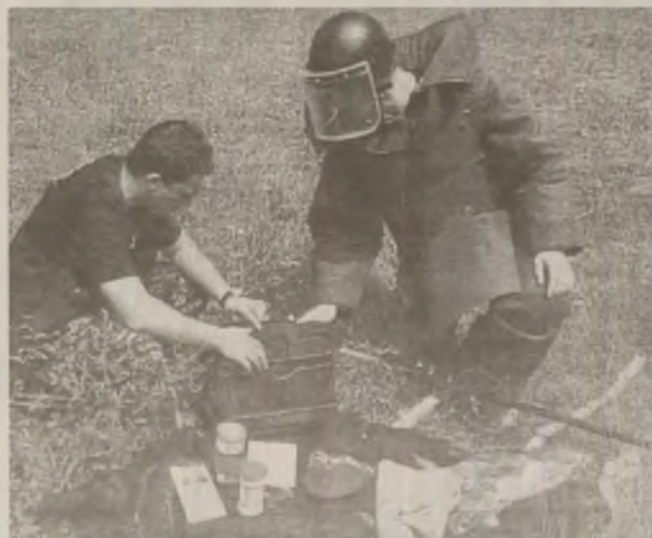
În locul explozibilului, pirotehniștii au găsit un borcan cu muștar