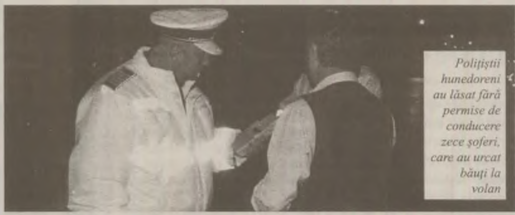
Polițiștii hunedoreni au lăsat fără permise de conducere zece șoferi, care au urcat băuți la volan