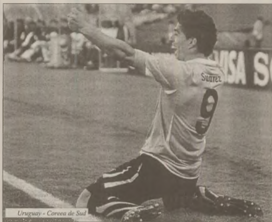
Uruguay - Coreea de Sud

Echipa națională a Coastei de Fildeș a învins, vineri, pe stadionul Mbombela din Nelspuit, cu scorul de 3-0, Coreea de Nord, în ultima etapă a grupei G de la Campionatul Mondial. Ivorienii aveau nevoie de un miracol pentru a merge mai departe în optimi, sperau la o victorie a Braziliei în fața Portugaliei. Dar acest lucru nu s-a întâmplat pentru că cele două echipe au evoluat la rezultat, având mai mult un joc prietenesc, dar foarte rușinos în același timp. Coasta de Fildeș a început în forță, obiectivul lor fiind să marcheze cât mai multe goluri. Primul a venit repede, în minutul 14, când Yaya Toure a deschis scorul, după ce a finalizat de la limita careului advers. Peste doar cinci minute Romaric a dublat avantajul africanilor, la capătul unei faze superbe a lui Drogba, care a preluat în careu și a șutat în bara transversală, mingea a ricoșat fericit la Romaric, care a deviat balonul cu capul în plasa porții asiatice. După pauză a fost același meci, cu atacuri în valuri