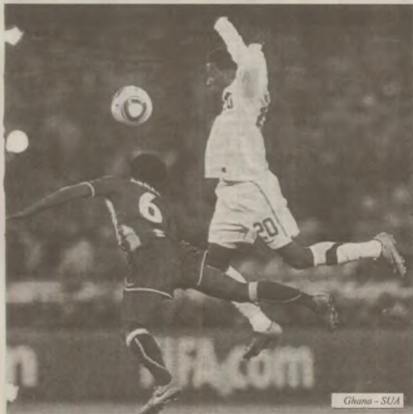
Ghana - SUA

Reprezentativa Ghanei s-a calificat în sferturile de finală ale Cupei Mondiale, după ce a învins, sâmbătă, la Rustenburg, cu scorul de 2-1 după prelungiri, selecționata Statelor Unite Ale Americii, în optimile competiției. „Black Stars” au început meciul în forță, aproape fiecare atac l-au dus cu o înverșunare de parcă era ultimul și în minutul șase au deschis scorul prin Boateng, la capătul unei faze frumoase de atac finalizate cu un șut puternic, care l-a surprins pe portarul american. La reluarea jocului, noul intrat pe teren, Benny Feilhaber, a avut o ocazie de a restabili egalitatea, dar portarul african a reușit să respingă. A fost semnalul de alarmă pe care ghanezii nu l-au tratat corespunzător, astfel că egalarea a venit cu un sfert de oră mai târziu, din penaltyul transformat de Landon Donovan. Ultimile 20 de minute ale partidei au fost controlate autoritar de americani care au mai ratat două ocazii de a marca și meciul s-a încheiat 1-1 după timpul regulamentar de joc. Au urmat apoi prelungirile, la trei minute după începutul acestora Gyan a marcat pentru 2-1. Americanii au dat totul pentru a mai reuși odată egalarea, dar acest lucru nu s-a mai întâmplat și Ghana a reușit o calificare istorică în sferturile de finală ale competiției, unde va întâlni Uruguayul.